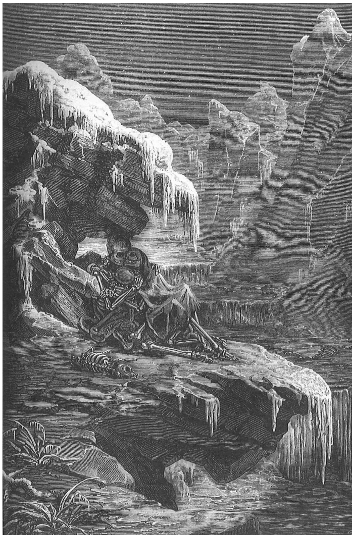
Fig. 3. Den framtida värmedöden. Den sista människofamiljen överraskas av kylan och begravs under ett evigt lager av is. Camille Flammarion, Astronomie populaire (1880).

var deras lyckosamma eller misslyckade respons på de fysiska eller sociala utmaningar de ställdes inför som avgjorde deras öde. Civilisationer, sade han, dör inte genom mord, utan av självmord.