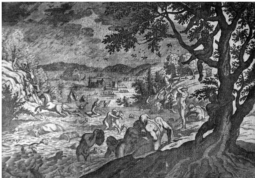
Fig. 1. Noa och syndafloden. Kopparstick av Johann Christoph Sartorius 1682–1684, ur Läse-bok för barn (1814).

Civilisationens undergång beskrivs i Gamla testamentet: Eva som åt av frukten från kunskapens träd, utdrivandet ur Edens lustgård, och Noa och syndafloden. (Fig. 1) Temat om världsåldrarnas slut i översvänningskatastrofer återfinns i akkadiska och babyloniska texter, i Vedaböckerna och i grekisk mytologi. Ett annat exempel på civilisatorisk undergång är Babels torn, som beskrivs i Första Mosebok 11:1–9, vilket betecknar mänskligt övermod och försyndelse mot Gud som leder till språkföribistring. Undergångens orsak gick alltså att finna i människan, i hennes synd, i brottet mot tabu. Det var det inre hotet, människan som orsak till hennes egen undergång, den kollektiva skulden. I det kristna linjära tidstänkande där världen var ändlig och Gud oändlig, blir mänsklighetens historia en del av frälsningshistorien. Tiden var utmätt. En tid ska komma då Kristus ska återkomma och Gud ska döma människan för hennes synder. I Johannes uppenbarelse skildras världshistoriens slut och det nya Jerusalems ankomst i målande bilder. Ett stort odjur stiger upp ur avgrunden med en sköka på ryggen med vilken jordens kungar har bedrivit hor. En medeltida tradition talar också om de femton tecken som kommer föregå Den yttersta domen, Quindecim signa ante judicium ,