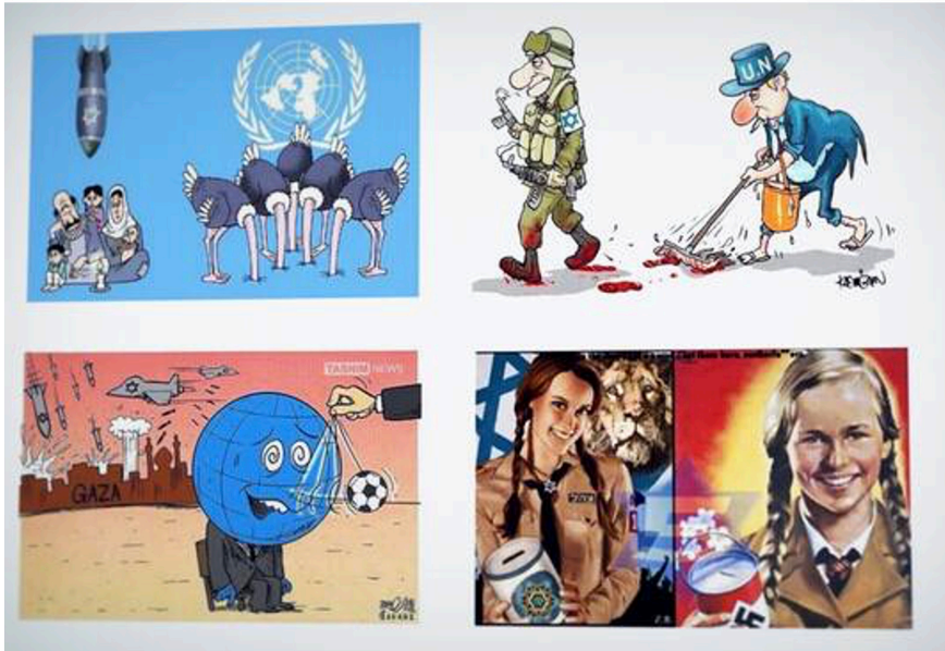
Figur 2. De fyra teckningarna som den utpekade läkaren delat på Facebook.

i Libanon osaklig, även om Israels mål med invasionen, enligt vissa bedömare, var att krossa PLO (se till exempel Schiff & Ya'ari 1984). Även antisemitiska tankestrukturer från den kristna idétraditionen överfördes på Israel i den svenska debatten under Libanonkriget 1982. Bibliska metaforer som "öga för öga", karikatyrer av Israels premiärminister Menachem Begin (1913-1992) som en "mordängel" och andra referenser till judendomens påstådda oförsonlighet och gammaltestamentlig hämndlystnad användes (Bachner 1999: 392).