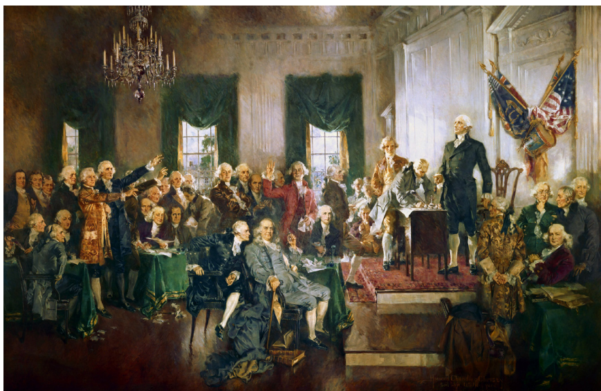
"Scene at the Signing of the Constitution of the United States" av Howard Chandler Christy

I samma stund som den amerikanska självständighetsförklaringen lästes upp i Philadelphia den 4 juli 1776 hade ett embryo till ett helt nytt politiskt system formulerats. Dokumentet som innebar att amerikanerna blev sammanbundna, inte av en gemensam historia och land, utan genom en lojalitet till den liberala republikanska ideologin blev startpunkten för "världens främsta demokrati" att ta form. Ett land som senare blev symbolen för – och ledaren av – "den fria världen".