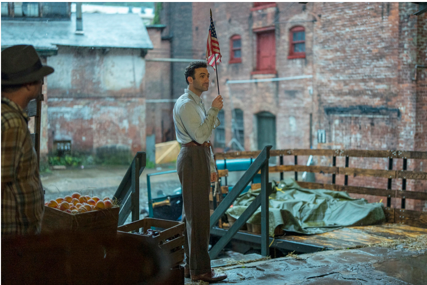
1. Patrioten Herman (Morgan Spector) med den amerikanska flaggan i högsta hugg.

Och det är mot bakgrund av dessa förmenta historiska händelser och denna politiska stämning som vi får följa familjen Levin under de berörda åren. Pappan Herman (Morgan Spector), försäkringsförsäljare, är vid sidan av sin judiska identitet en övertygad amerikansk patriot. Han är, precis som