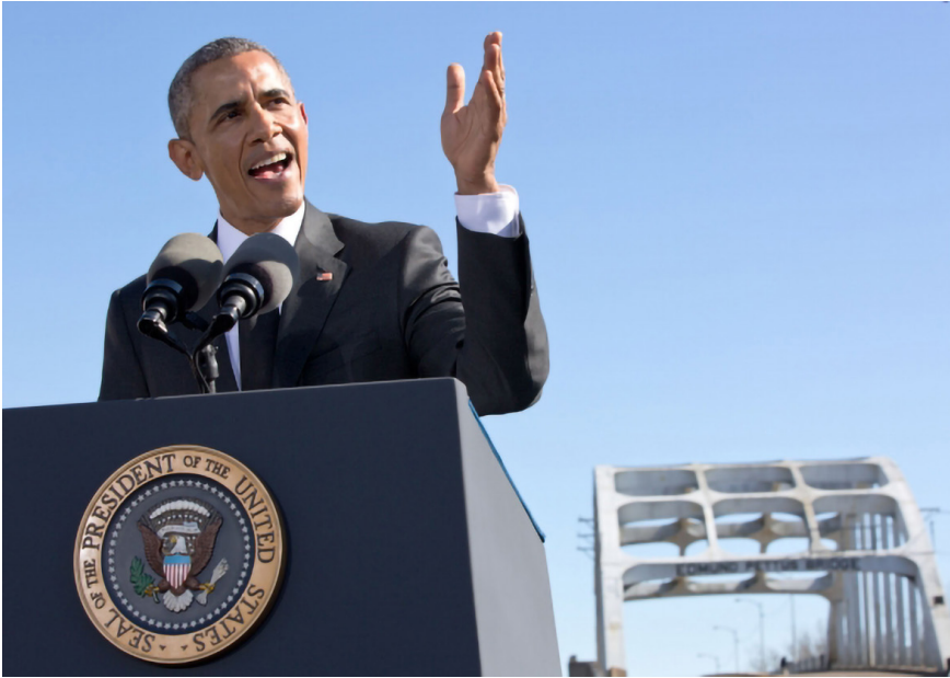
Bild 2. Barack Obama talar vid 50-årsminnet av "Bloody Sunday" i Selma, Alabama.

daring of America's character". Bland dem nämnde han Independence Hall, Seneca Falls och Cape Canaveral. Alla ingår som centrala delar i en amerikansk historisk kanon och är mycket populära destinationer för alla som vill känna sig delaktiga i den amerikanska historien.