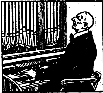
Orgelvirtuosen Bruckner vid sin Rieger-Organ.

JÄGERNDORF, TJECKOSLOVAKIET, bygger världsberömda kyrkorglar.