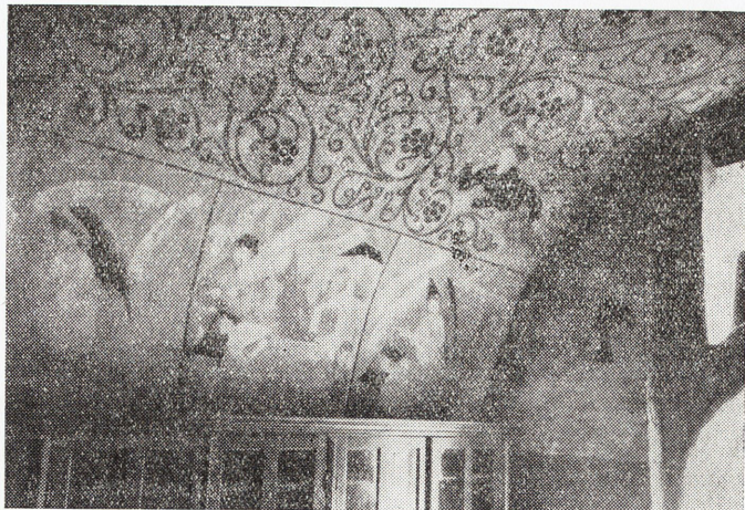
Där vapenhusen redan under senmedeltiden murades av sten, utformades de ofta som kapell med altaren och målades på tak och väggar liksom kyrkan i övrigt. Ovan ett prov på målad vapenhusvägg från Sorunda kyrka i Södermanland.

stå kvar med murarna bevarade, utan spår av bräscher och brand. Orsaken härtill är givetvis den att kyrkorna i motsats till stormansgårdarna underhållits av socknen och i princip äro s. a. s. evighetsbetonade. Många ha utan tvivel bränts och skövlats, men faktum kvarstår att de ej i grund förintats så som krigarfästena. Fienden har bränt sockenkyrkor (liksom han ofta bemödade sig om att nå upp till det fredliga stiftcentret och brännmärka katedralen) av terroristiska- eller prestigeskäl. Men någon fruktan för kyrkorna ur strategisk eller fortifikatorisk synpunkt har han näppeligen behövt hysa.