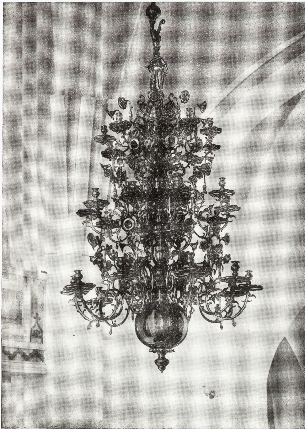
Ljuskrone från Skultuna bruk i Söderköpings stadskyrka, levererad 1693 (efter Sigvard Erixon, Mässing).