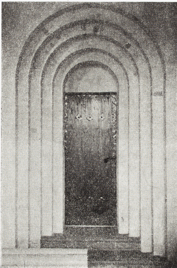
Ingång från kor till sakristia. (Innan tympanon erhöill kalkmålning.)

Söndrums sakristia står såsom en förebild för hur en sakristia kan ordnas ändamålsenligt och vackert. Vid sidan om sina rent praktiska uppgifter att vara väntrum för officianten mellan de olika delarna av gudstjänsten och i viss mån expeditjonsrum utgör den en till andakt bjudande bönekammare, i vilken ingenting »står framme och skräpar», enär föremål av mera profan natur genom ett väl genomfört tillvaratagande av utrymmet i byggnadskroppen tilldelats dolda förvaringsrum. Vid inträdet från kyrkans kor kommer man närmast att tänka på ett absidförsett sidokapell i en korsformig, större medeltidskyrkas tvärarm.