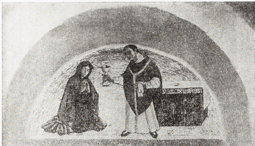
Kalkmålning å södra sidan av tympanon över dörr mellan kor och sakristia.

På ömse sidor om altaret finnas i absidens mur fördjupningar för »sakramentshus» i norr och piscina i söder. Dessa ha dekorativa omramningar i polykrom skulptur. Den förra har dessutom dörr i samma behandling.