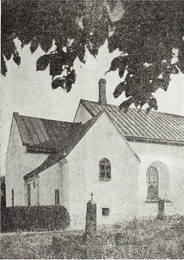
Kyrkans korparti och sakristia.

Det kan ur utseendesynpunkt ofta vara en vanskelig sak att göra en tillbyggnad till en välproportionerad medeltida byggnadskropp. Så som detta gjorts i Söndrum, kan man dock konstatera, att det skett på ett lyckligt sätt. Den nya byggnadsdelens väl avvägda proportioner göra, att man vid betraktandet av kyrkans exteriör från nordost icke får intryck av att något »påhängts» kyrkan, såsom vid tillbyggnader icke sällan blir fallet, utan att det nya bildar ett organiskt helt med det gamla. Den nya delen är likväl icke utförd såsom någon långt gående, antikiserande pastisch. Genom att byggnaden erhållit en av förekomsten av en gravvård föranledd indragning i nordöstra hörnet, har dess norra gavel undgått att få samma relativt stora bredd, som sakristian i övrigt äger.