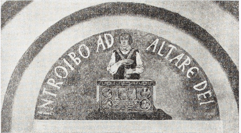
Kalkmålning å norra sidan av tympanon över dörr mellan kor och sakristia.

Dörröppningen mellan sakristia och kor är tresprångad mot det förra och fyrsprångad mot det senare rummet. Öppningens tympanonfält visar mot norr officianten i skrud bärande kalk och patén fram till altarbordet under rundbågigt formad inskriftsrad: INTROIBO AD ALTARE DEI. På södra sidan visar samma tympanon en bild av nattvardens utdelande. Målningarna äro utförda av konstnären Erik Abrahamsson 1939 i färgrik kalk, i det förra fallet mot blå botten, i det senare mot guld. Dörren av trä har dekorativa kantbeslag av järn.