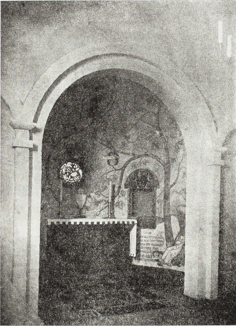
Söndrums kyrka. Interiör av sakristian med absid.