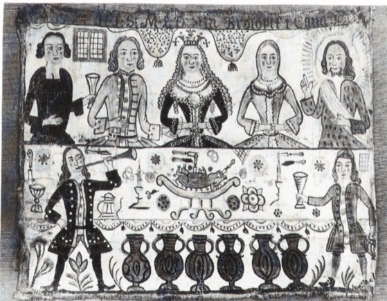
Bröllopet i Kana. Bonad på väv från Södra Unnaryd, Småland 1774. Nordiska museet (Folklivsarkivet, Lund)

Vid brudens plats stod en tallrik på vilken hon lade upp lite av varje rätt. Denna tallrik fick senare någon tillstädeskommen tiggare som kvitterade vänligheten genom att i vida kretsar sprida ryktet om bröllopets ståtlighet. Genom penninginsamlingar till de fattiga kunde de burgna nördtorftigt ursäka sitt eget överdåd.