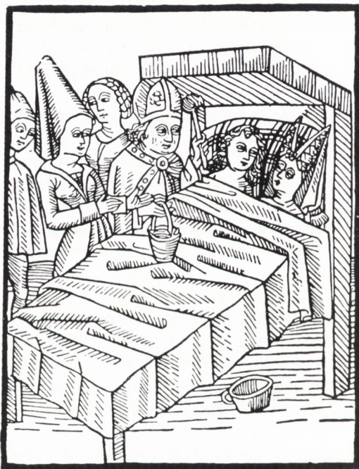
Den katolska kyrkan förvandlade den förkristliga sängledningsceremonin till en kristen välsignelseakt. Här bestänker en biskop brudsängen med vigvatten. Tyskt träsnitt från 1400-talet

En sådan, nästan liturgisk, roll hade även den paradssäng som tillfälligt inbars i rikssalen på Stockholms slott vid kungliga biläger och där brudparet i gästernas närvaro satt under en särskild kyrklig ceremoni, den s k sängledningen.