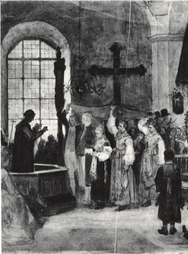
Bröllop i Floda. Detalj ur akvarellskiss av C G Hellqvist (Folklivsarkivet, Lund)

Att delta i en bröllopsfest kunde varje kristen göra med gott samvete. Man kunde rentav som Uppenbarelsebokens författare föreställa sig den himmelska härligheten med en bröllopsmetafor: "Och jag såg den heliga staden, ett nytt Jeusalem, komma ned från himmelen, från Gud, färdigsmydd som en brud som är prydd för sin brudgum" (Upp 21:2).