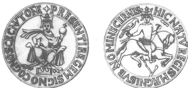
Fig 1. Kungl Bibl, Stockholm: Fh 13, s. 87. Knud den Helliges segl.