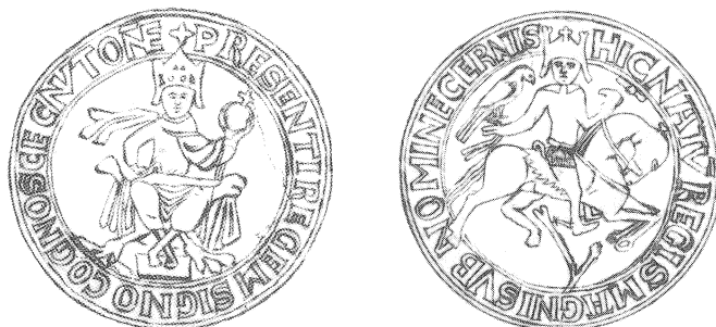
Fig 3. Kungl Bibl, Stockholm: Fh 13, s. 88, Knud den Helliges segl, “ældste” tegning.

Hvad der nu har interesse er at notere sig de punkter, hvor tegningerne viser forskelle, der går udover det rent stilistiske – en afgrænsning der dog er vanskelig at foretage. Idet sådanne forskelle skulle kunne indicere hvor forlæggert har været uklart eller eventuelt defekt.