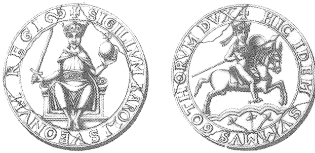
Fig 5. Karl Sverkerssons segl.

indeholdt kunne være, at når Peringskiöld på sin tegning af Knud den Helliges segl afbilder elementer vi ikke genfinder på andre af hans segltegninger, så er det fordi det han fandt på dette segl ikke lod sig identificere med tilsvarende elementer på hans andre, hovedsageligt svenske seglforlæg. I så fald skulle vi kunne regne med, at Peringskiöld på aversen af Knud den Helliges segl forefandt en fyrste, iklædt en usædvanlig hovedbeklædning, siddende på en sædvanlig trone; mens han på reversen sandsynligvis har forefundet en falkerytter.