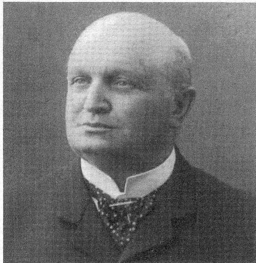
Forsvarsminister Wilhelm Olsson.

Olsson svarte ikke på disse anklagene. I stedet redegjorde Michelsen selv for både ansvarsforholdet og uenigheten i regjeringen. Han innrømmet at helt siden unionsoppløsningen hadde det hendt at Olsson hadde kommet med forslag som "ikke blev til noget, fordi de vakte Motstand hos hans civile Kolleger i Regjeringen". Derfor var det også urettferdig å bedømme Olssøns "Stilling ud fra hvad der saaes i det Ydre". Regjeringen og Michelsen selv var det som bar ansvaret: "Havde man noget at anke over i den Anledning, saa er Adressen os og ikke Statsraad Olsson." 53