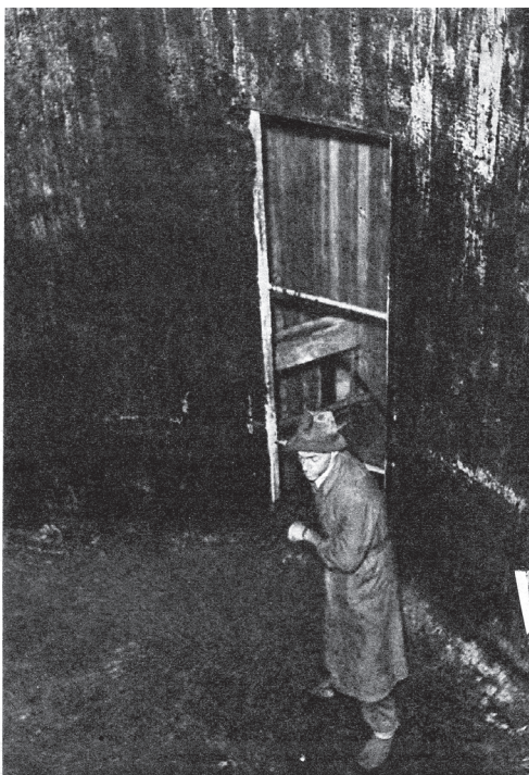
AIV-SILOS hör till rationell mjölkproduktion. Andelsladugården har två AIV-silos. Luftkonditioneringen är utmärkt och ladugården är praktiskt taget luktfri. Utgödslingen sker helt automatiskt. Alla transporter sker på transportbånar och med elkraft. Ladugården innehåller även tröskverk. Den mjölktekniska utrustningen är naturligtvis fullt tidsenlig, varför arbetet blir mycket lättare trots koantalet per man är mycket större.