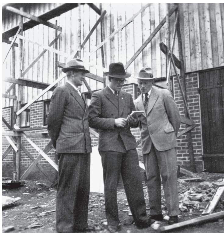
Det pågående bygget av Bjärme andelsladugård inspekteras av några styrelseledamöter 1944. Här kan viktiga aspekter av visionen för andelsladugården ses sammanfattade i bild: manliga aktörer planerar för en storskalig, rationell mjölkproduktion, på grundval av tillgängligt expertkunnande.

förädling av råvaror. I en samtida debatt beskrevs dock denna organisering av skogsarbetarhushållens försörjning som irrationell, både för jordbruksnäringen och för skogsindustrin. 47 Särskilt mjölkproduktionen hamnade här i fokus. Den kvantitativt mestadels mycket begränsade produktionen av mjölk i skogsarbetarhushållen utgjorde ändå en försörjningsbas, för egen konsumtion, men även i form av inkomster från mejerileveranser och försäljning av t.ex. smör. Arbetet med korna och mjölkberedningen var så gott som uteslutande kvinnligt kodat, alltså småbrukarhustrurnas ansvar.