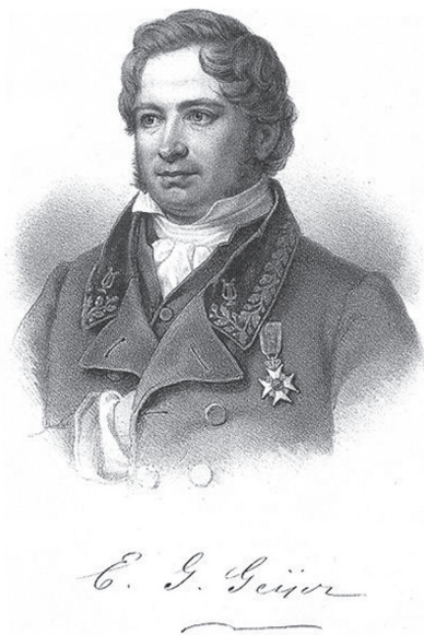
Erik Gustaf Geijer (1783–1847). Källa: Erik Gustaf Geijer, Samlade skrifter . Band 1, Stockholm 1875.

Under Krimkriget 1853–1856 blev Finland återigen ett hett diskussionsämne i den svenska opinionen. Nu handlade det emellertid inte särskilt mycket om själva krigsnederlaget 1809 eller om förhållandena mellan Sverige och Finland årtiondena därefter. Snarare innebar motsättningarna mellan i synnerhet Frankrike, Storbritannien, Sardinien och Osmanska riket på den ena sidan, och, på den andra Ryssland, en chans till en sista uppflammande återkomst av en svensk stormakt på den internationella scenen. Rysslandsfientligheten