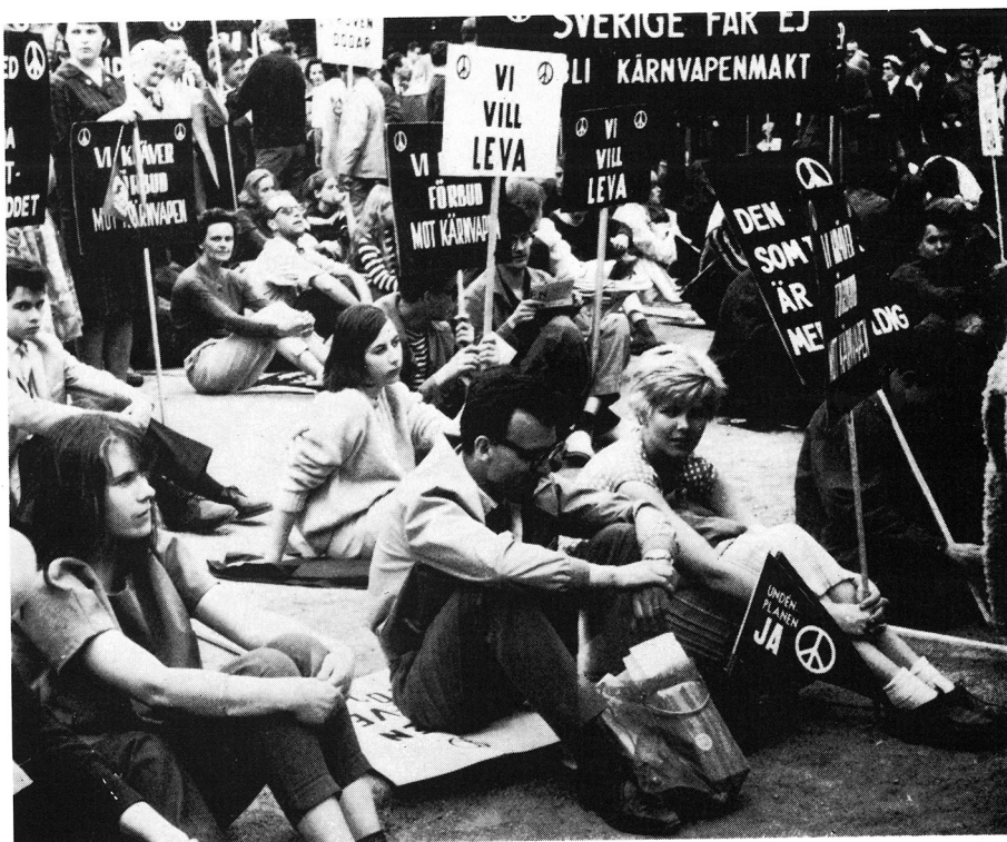
Fig. 3. Ungdomar i Vasaparken efter pingstmarschen 1962. Ur Fogelström 1971.

genomfördes nu för övrigt också i Göteborg, där flera mindre tåg utgick från några förorter och sammanstrålade på Götaplatsen. 94