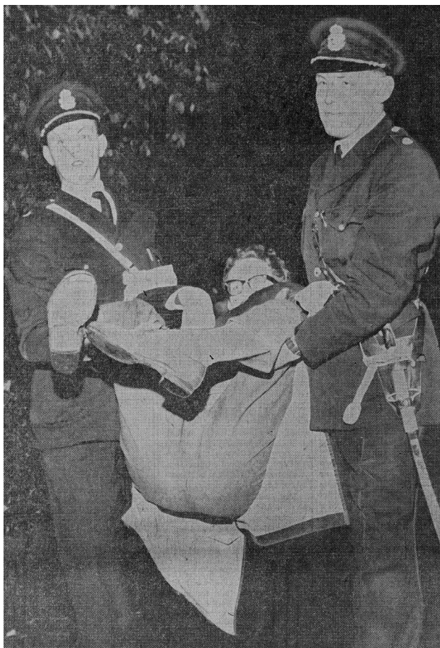
Fig. 1. Polisen bär bort en aktivist vid den första ambassadaktionen.

hade polisen redan spärrat av ambassadområdet. Aktivisterna valde därför i stället att slå sig ner mitt i korsningen Villagatan/Östermalmsgatan. Där fick de sitta en stund innan polisen beordrade dem att flytta upp på trottoarerna så att trafiken inte hindrades. De flesta lydde, men en del vägrade och blev därför ivägburna av polismännen. Ytterligare ett par ungdomar greps när de försökte ta sig runt poliskedjorna genom de villatradgårdar som omgav ambassaden. Efter två timmar var aktionen över. 73