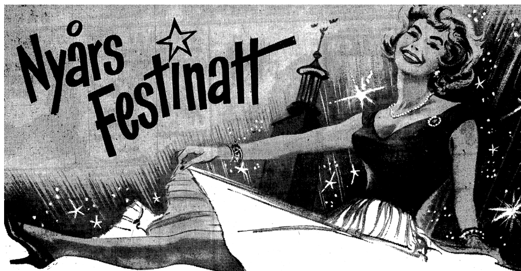
Figur 2: Ett år efter nyårskravallerna lade Stockholms stad stora resurser på att få ungdomar att välja att tillbringa nyårsnatten på ungdomsgårdarna. Stora annonser i dagstidningarna erbjöd festliga alternativ till folksamlingarna på Kungsgatan. Ur Aftonbladet 30 december 1957.

stadens ungdomsgårdar. 44 Fyra dagar senare presenterades idén offentligt av Hjalmar Mehr i ett svar på en kommunistisk interpellation om kravallerna, ett samband som antyder en nära kontakt mellan barnavårdsnämndens högste tjänsteman och dess politiskt tillsatte ordförande. Mehr var en vänsterinriktad socialdemokrat som gärna sökte ideologisk konflikt med de borgerliga partierna i stadshuset. Det var inte första gången han uttalade sig om ungdomsupplopp. Efter att kravaller ägt rum i Berzelii park sommaren 1951 hade han hävdade att sådana oroligheter borde förebyggas genom en utbyggnad av Stockholms ungdomsgårdar. 45 När han nu analyserade nyårskravallerna byggde han vidare på den idén.