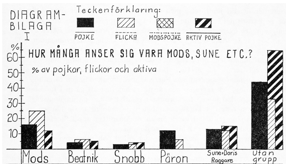
Figur 3: Intervjuerna med de omhändertagna ungdomarna visade att det endast var en liten del av Hötorgskravallernas deltagare som själva identifierade sig som mods. Ur "Hötorgskravallerna i Stockholm hösten 1965 (Bihang till stadskollegiets utlåtanden och memorial nr. 93)", i Stockholms stadsfullmäktiges handlingar 1967, s. 54.

att utredarna lade skulden på modsen. Tvärtom betonade de att det var "normalt och tolerabelt" att ungdomar valde att avvika i utseende. Det var inte ungdomskulturernas existens som var problemet utan motsättningen mellan dem, och förekomsten av "rivaliserande ungdomsgrupper måste säkert betraktas som en av förutsättningarna för kravallernas uppkomst". 61