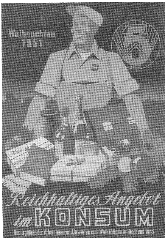
Reklamaffisch för Östtyska konsum.

Tyskland etablerat sig sedan 1990-talet. Om den tyska politiska elitens minnespolitik – så som den tar sig uttryck i statliga minnesceremonier och retoriska formler vid minnesdagar förmår förena Förintelsens minne och diskursen om tyskarna som offer i en nationellt identitetsskapande syntes, är det inte fallet för det populärhistoriska alster som här diskuterats.