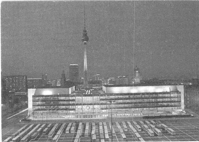
Palast der Republik, förmodligen 1980-talet.

Entrén är förhållandevis blygsam och museet består egentligen av ett enda rum indelat i sektioner med cirka två meter höga vita väggsektioner som för tankarna till en "Plattenbau", den höghuskonstruktion som symboliserar det östtyska miljonprogrammet under 1960- och 1970-talen. Känslan av att vistas i en låtsasvärld är därför påtaglig av själva rummet. Stäendes i biljetluckan kan besökaren överblicka snart när hela museet för att sedan gå en halvtrappa ned och bli ett med dockhuset. I enlighet med vad som tycks vara det nya millenniets rådande museiideologi är utställningen tematiserad och saknar en tydlig berättelsestråd. Någon övergripande tidslinje finns inte att tillgå och besökaren vandrar runt bland teman som mode, yrkesliv, fritid och semester, medier, familjeliv, utbildning och shopping.