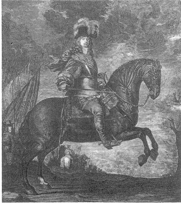
David Klöckers porträtt av Wrangel från 1652.

iscensätta en procession eller liknande för att vinna en kontinuerlig legitimering av generalguvernörens maktposition. Så till exempel passade Johan Jacob Hastfehr, som var generalguvernör i Livland 1686–1695 på att organisera ”eine bessere parade” i Riga när han fått ett exklusivt hästspann i present. 50