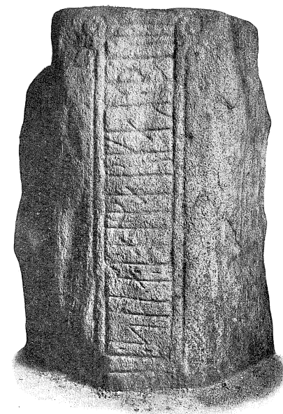
B-Siden. 1 : 20. Kong Gorms Monument.