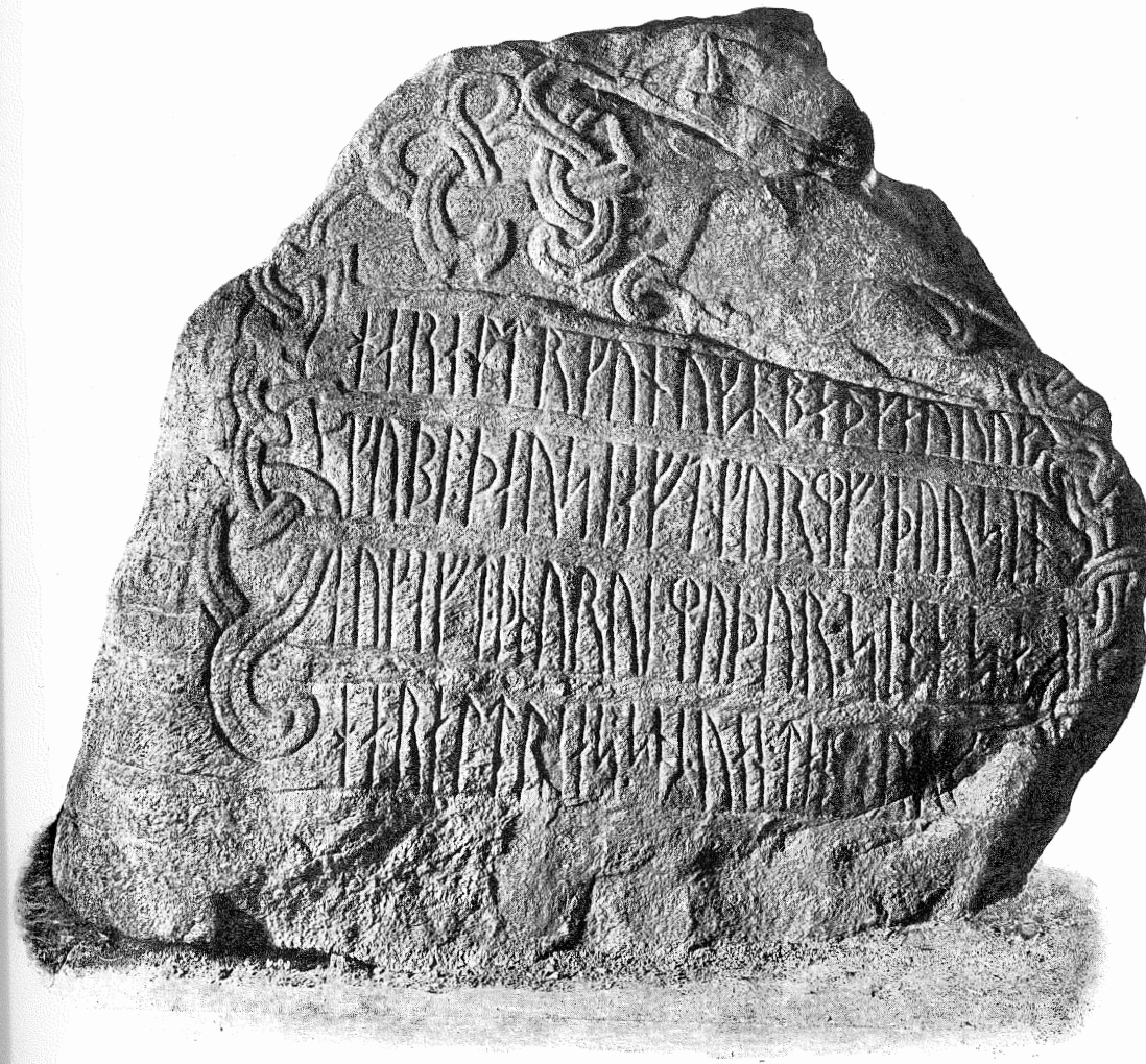
Kong Haralds Monument.