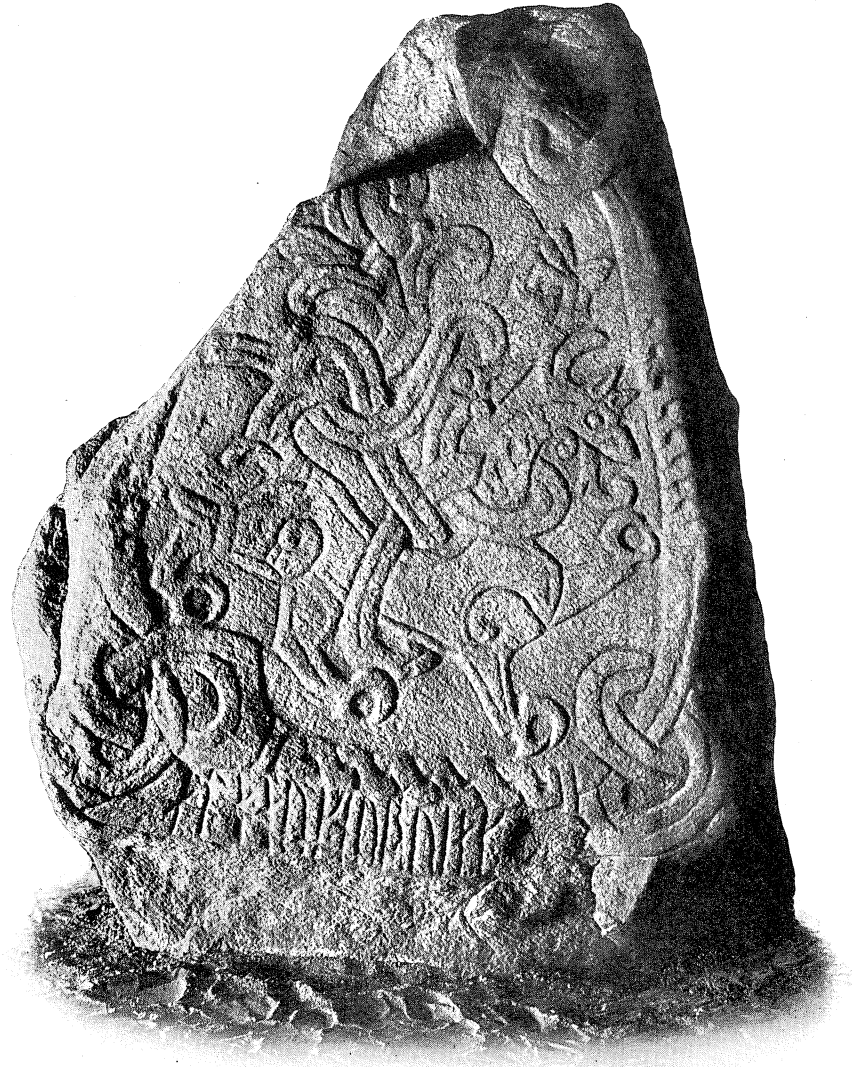
B-Siden. 1 : 20.