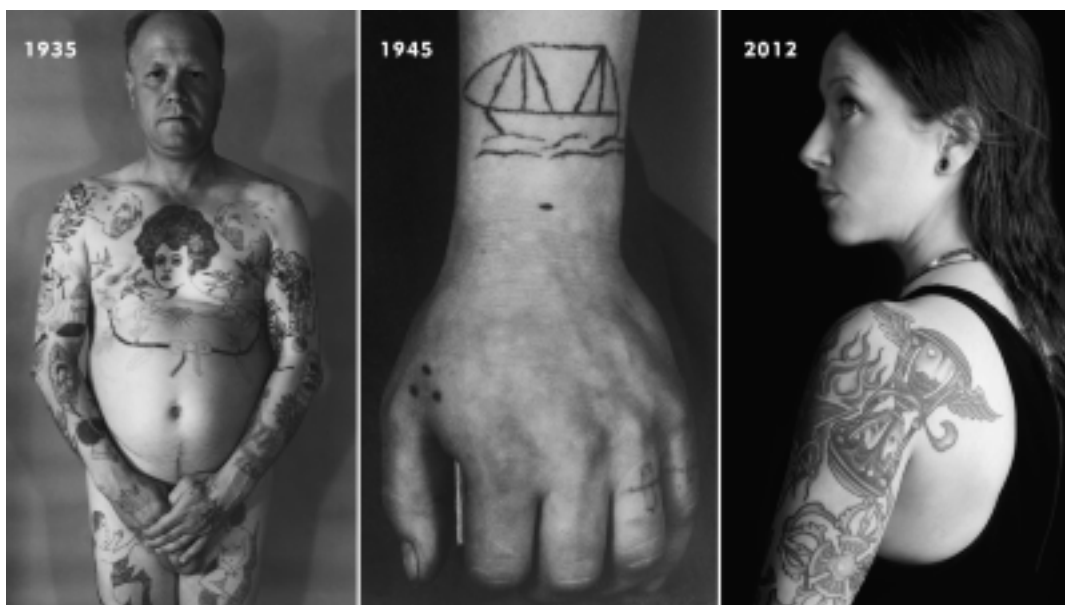
Fig. 4 Karakteristiska exempel på hur tatuerade sjömän fotodokumenterats vid tre olika tillfällen under Sjöhistoriska museets historia av tatueringssamlande. I bilderna återspeglas museets blick på sjömannen och olika intressen för tatueringar.

befolkningselement. De decennier som föregick bildandet av tatueringssamlingen hade ett antal välbesökta utställningar, vetenskapliga artiklar och undersökningar på temat ”svenska folk- och rastyper” presenterats. Dessa satte en slags standard för hur man fotodokumenterade människor och därigenom stöpte om dem till vetenskapligt material. I denna diskurs ingick också att värdera materialet och peka ut ”föredömliga och sunda” respektive ”degenererade” människor och socialgrupper (Hagerman 2011).