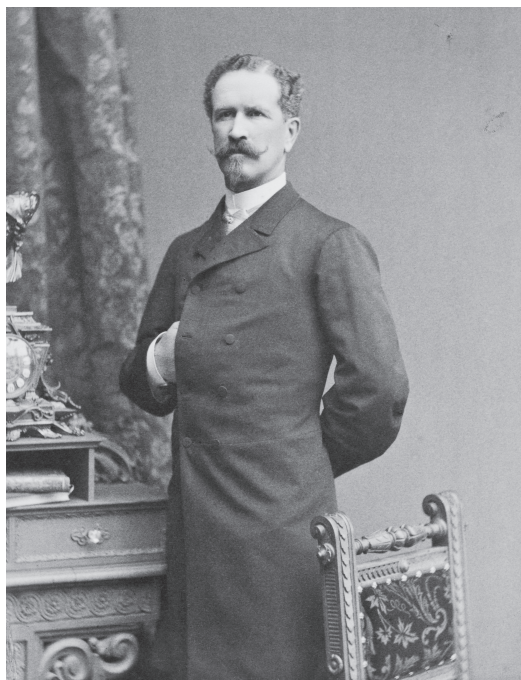
Greve Walther von Hallwyl, 1870-t.

Everts sjöbod, som texten ovan handlar om, är ett mindre företag från Grebbestad. De erbjuder hummersafari, ostronprovning, fiske, båtturer och paketresor med övernattnig och dessutom allt detta i olika kombinationer. Även i detta exempel på lokal marknadsföring