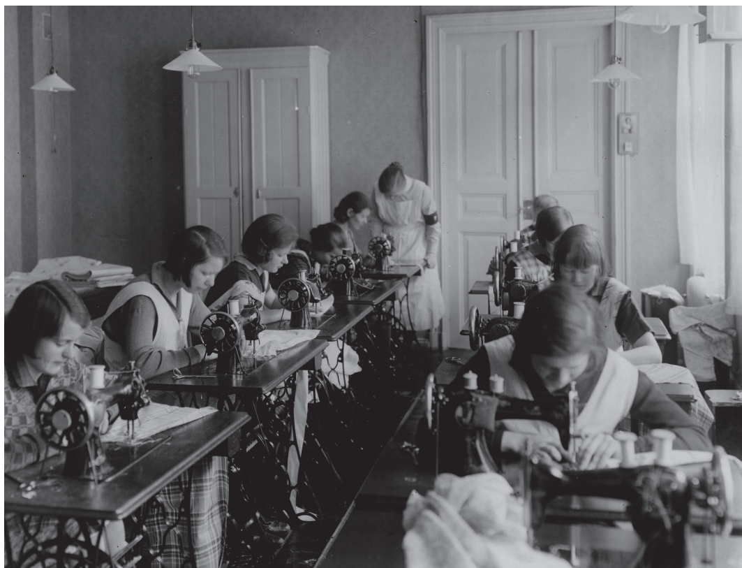
Fotografiet skildrar den flit och ordning som, idealt sett, präglade verksamheten i räddningshemmens arbetsalar.