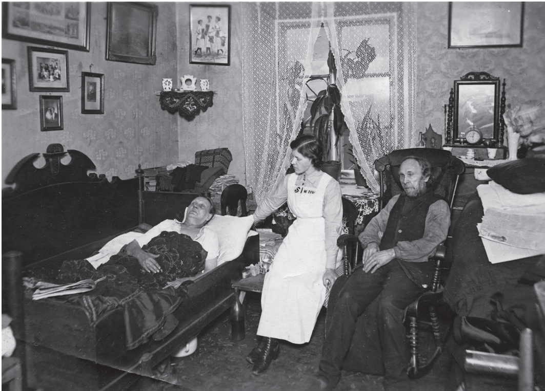
I slumstrans vardag utgjorde hembesök hos gamla och utsatta en viktig arbetsuppgift.

grepp som Frälsningsarmén påbörjade sitt arbete med gästfriheten som moralisk kompass, men var det en gränslös praktik som Nya testamentet föreskrev eller tydliggjordes snarare sociala hierarkier genom arbetet? Jag inleder med en kort diskussion av Frälsningsarméns föreställningar om de prostituerade och staden för att därefter närma mig huvudfrågan.