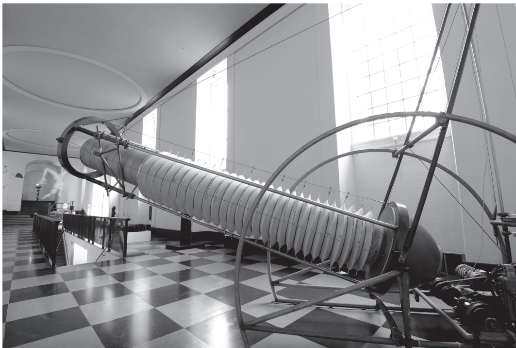
Ulf Rollofs Bälg IV – en kombination av lössläpphet och hantverksskicklighet. Foto: Göteborgs konstmuseum.

passivt väntar på mannen i sitt liv eller på att barnen ska växa upp. Här är det kvinnor som väntar på varandra.