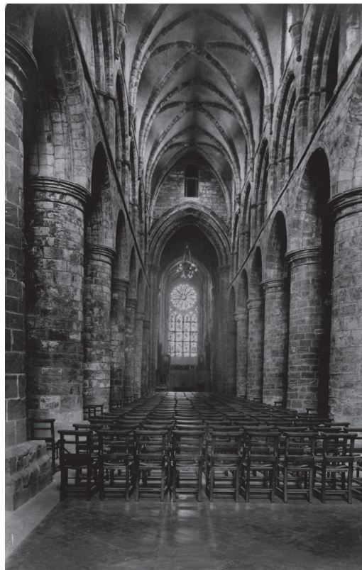
Interiör av S:t Magnus-katedralen i Kirkwall. Postkort.