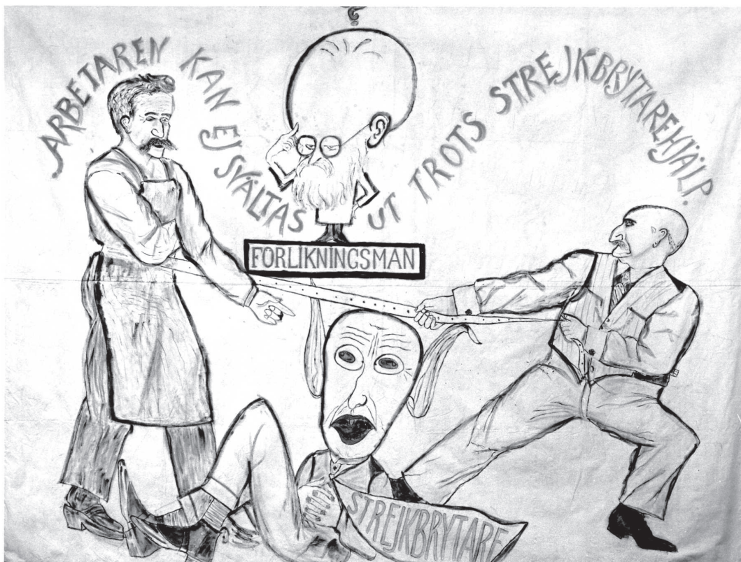
I samband med 1 maj-demonstrationen 1927 beslagtogs Malmöpolisens ett standar med texten "Arbetarna kan ej svältas ut trots strejkbrytarehjälp". Det är lätt att se att stigmatiseringen av "strejkbrytaren" också sträckte sig utanför arbetarpressens texter.

Hans brott ointetgjorde effekterna av arbetarklassens mest verkningsfulla vapen: strejken" (Lindqvist 1994:126). Men hur skulle man veta vem som var "strejkbrytare"? I viss mån var strejkbrytarna "osynliga" för blotta ögat vilket gjorde dem "dubbelt farliga". Trots sitt förräderi kunde de komma undan med sina "brott" (jfr Lindqvist 1994:126). Inte minst därför kan blockadannonsernas utpekande ses ha varit centrala för arbetarsidan. Därför var också förföljelserna, eller "uppvaktningarna", viktiga då de visade att "vi ser dig, du kommer inte undan" (jfr Goffman 1972:55ff, 73ff). Vänsterpressens utpekande av "strejkbrytare" kan således ses som en social stigmatisering som fick tydliga konsekvenser. Men det var inte bara i blockadannonserna denna stigmatisering