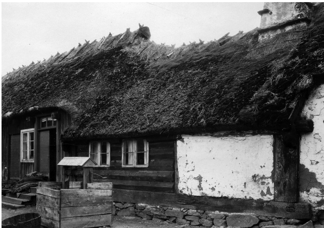
Gården Glimminge 1 i Färingtofta socken dokumenterades flera gånger om av olika byggnadsforskare. Boningshuset av sydgötisk typ drog till sig intresse från omvärlden, men gårdens arrendatorsfamilj valde att flytta därifrån på 1940-talet och ägaren Barsebäcks gods lät sedan riva gården.

finns ett par foton av ryggåsstugan tagna 1924 av Bengt Engström. 1928 kom så Albert Nilsson dit och gjorde ungefär samma dokumentationsinsats som 1921 års expedition, och 1932 var det alltså dags för ett besök igen i sällskap med Zangenberg. Bilderna från de olika fotograferingstillfällena visar precis samma sak, ryggåsstugan med ovanligt breda plankor och tillhörande ekonomibyggnader. 17 Zangenberg var inte ute på någon upptäcktsfärd där han hittade dittills odokumenterade objekt, utan hans svenska följeslagare tog honom till en för dem redan välkänd stuga som passade in i mallen för byggnadskultur i risbygden. Dessutom var den ett gott studieobjekt för Zangenberg som ville lära sig mer om svensk träbyggnadsteknik. Det fanns alltså rikligt med dokumentationsmaterial i olika arkiv som visade hur stugan såg ut och