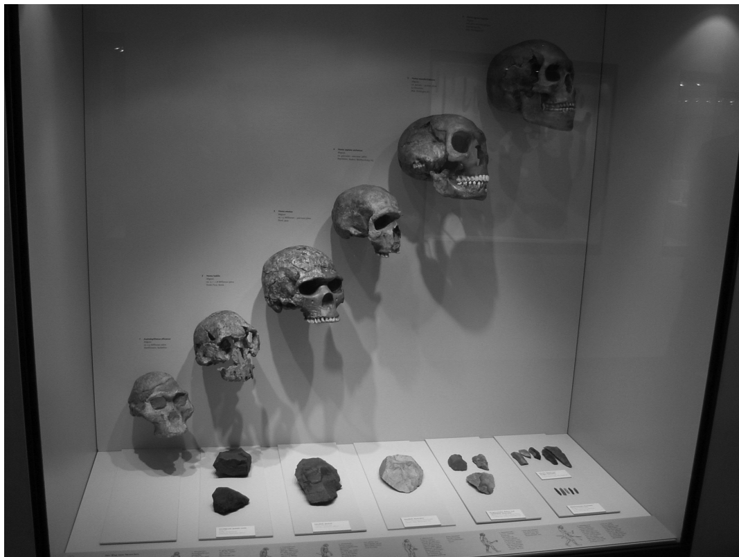
Ett exempel på tingens roll för uppfattningar om kulturell (och biologisk) evolutionism. Från Museum für Vor- und Frühgeschichte, Berlin, 2008.