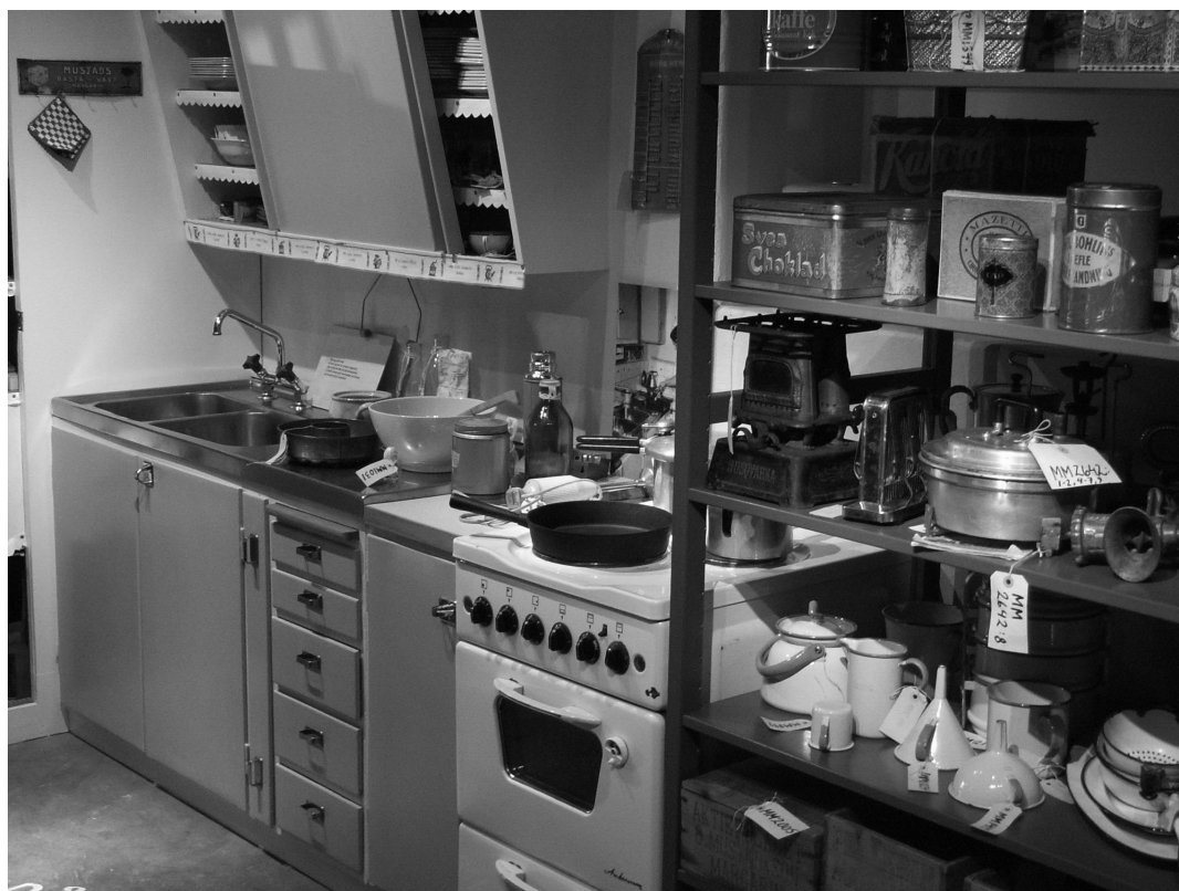
Vardagens ting, katalogiserade, kategoriserade och utställda på museum. Mölndals museum, våren 2005.

omedvetna betydelsedimensioner för de människor som brukade dem. En epistemologisk brytning har därefter skett genom institutionaliseringen. Essentiell mening och sammanhang har förlorats, eftersom det musealiserade föremålet har institutionaliserats. Musealiseringen har skett för vår förståelse, vilken följaktligen aldrig kan bli helt densamma som den ursprungliga betydelsen. Argumentet har tveklöst sina reflexiva poänger, men i sin iver att kritisera museets oförmåga att återge den sanna bilden av det förflutna, förlorar Pearce förståelsen för museet som institution. Det förflutna är självfallet "forever lost to us", men det har heller aldrig varit museets roll eller möjliga mål att återge det förflutna i ett autentiskt ett-till-ett-förhållande. Museutställningar har alltid och kommer alltid att baseras på narrativa uttryck som förutsätter