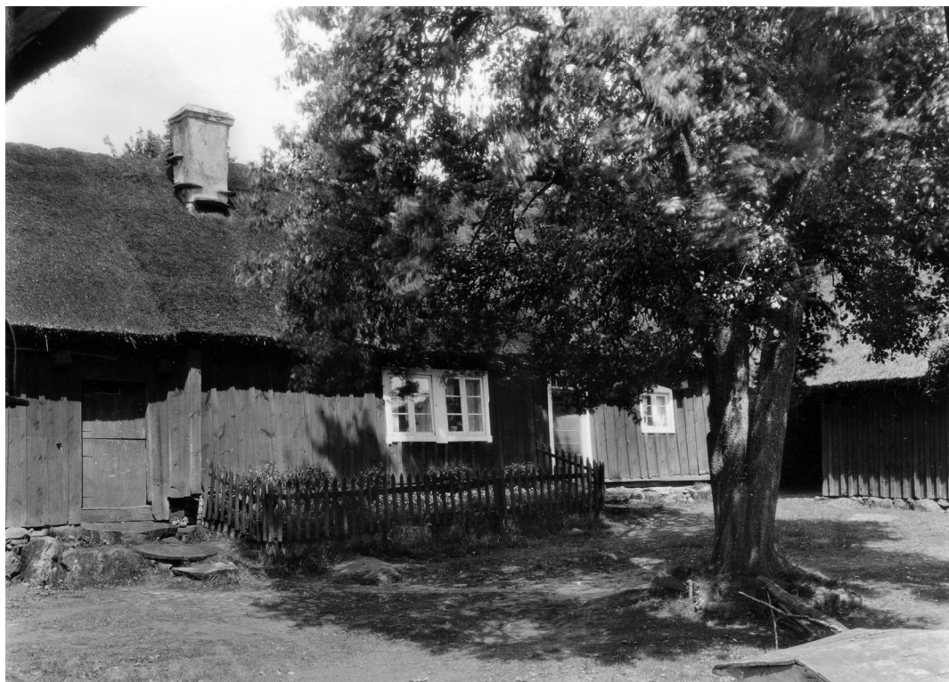
Bild av Bollaltebygget i Knäred. Fotot togs av Zangenberg vid en veckolång studieresa 1932 där han och hans kollega Arne Ludvigsen fick tillfälle att se exempel på svensk träbyggnadsteknik. Efter forskarnas besök köptes gården så småningom av en lokal hembygdsförening, och dess kulturarvsegenskaper kom att förstärkas när den byggdes om till ett skick som betraktades som äldre och mer autentiskt.

Folklivsarkivet, Lund och i Nationalmuseet, Köpenhamn.