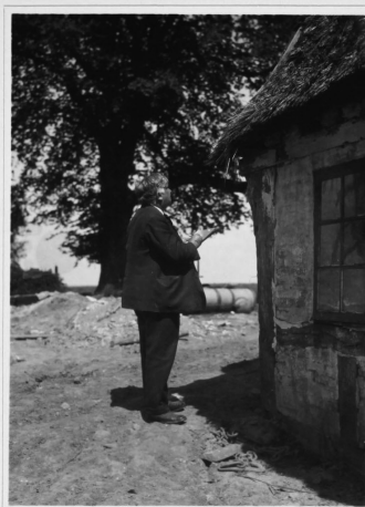
•PAA•UNDERSØGEL•SE•SREJSE• •I•SØNDERJYLLAND• •SOMMEREN•1930•