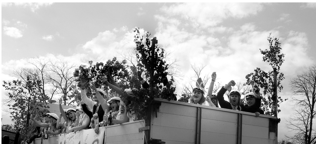
Studentvecka i Lund 2008. Gymnasieutgångsklass skanderar.

”bästa rocklåt”, och har av tidskriften New Musical Express nominerats till ”femte bästa rocklåt” i världen 1996–2006 (Rocklist.net). Gruppen, som är en duo, består av Jack White på gitarr och sång samt Meg White på trummor. Som efternamnen antyder har de varit gifta. Paret ska idag vara skilda, men gruppen är fortfarande aktiv. Senaste studioalbumet, Icky Thump , är från 2007 och 2010 släppte gruppen sitt första livealbum, Under Great White Northern Lights . Ett av gruppens utmärkande drag är att den med få instrument skapar tungt klingande rockmusik. De använder sig primärt av enbart gitarr, sång och trummor, vilket grundar sig i det faktum att de är en duo. Någon gång använder de andra instrument som piano och marimba, dock inte elbas. Låten ”Seven Nation Army” är uppbyggd av just gitarr, sång och trummor och ger den minimalistiska men ändå vägande ton som kännetecknar gruppens musik. 4/4-takten i låten är dessutom väl understödd av de konsekventa trummorna som påminner om marschtakt. 25 Den halvakkustiska elgitarren stämd i öppet ”A” spelar det framträdande riffet som en enstämmig melodi (e-e-g-e-d-c-b) med oktavpedal, dessutom distorderat. Att gitarren är nedåt oktaverad gör att den i stort sett låter som och delvis har funktionen