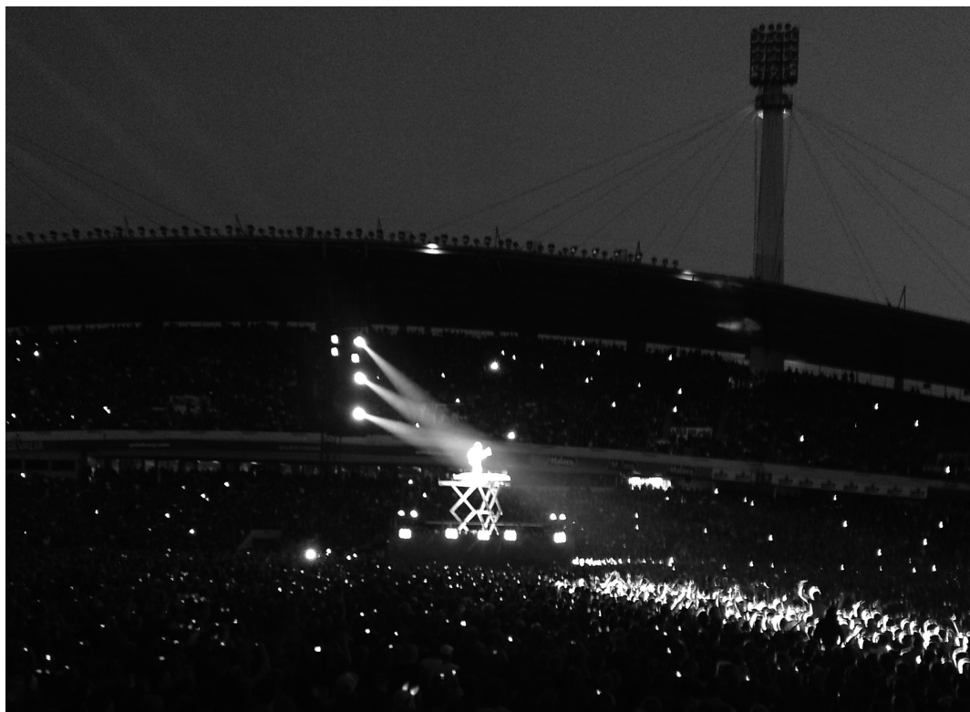
Rockkonsert på Ullevi, Göteborg juni 2009. Publiken svarar med cigarettändare, lysande diadem och mobilkameror.

Fotboll har framställts som en modern form av gladiatorspel, den urbana människans behov av skådespel (Elias & Dunning