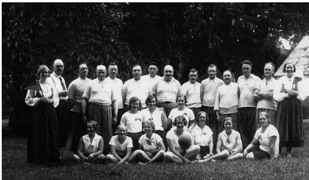
”Gubbamatch”. Ungt damlag sittande framför ett veteranlag bestående av herrar. Lagen flankeras av två kvinnor i folkdräkt med vimpel i hand. Börringe, Skåne, omkring år 1940.