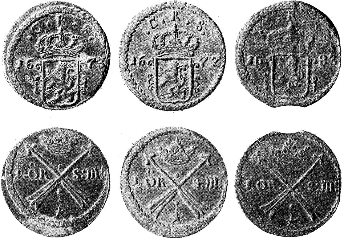
2. Några av de kopparmynt som lågo i penningpungen, fig. 1.

sättningen av kopparskiljemyntets vikt kom år 1680 7 — utan att fördenskull vilja påstå, att den obetydliga teoretiska viktskillnaden, ca 2 gram, skulle ha haft någon betydelse. Viktuppgifterna tyda knappast på att myntförordningarna följts med större noggrannhet. På enskilda årtals förekomst kan man tydligen ej alls bygga något; 1679 och 1684 med sina låga präglingssiffror äro ej företrädda alls, medan 1683, då nästan lika få mynt utgävos, representeras av 3 exemplar!