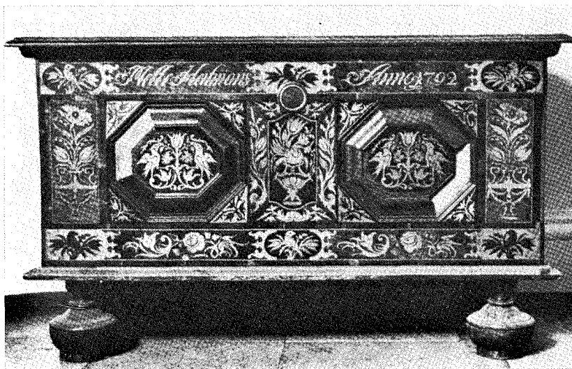
Kista med intarsia, dat. 1792. Från Altengamme, Vierlanden. Museum für Kunst und Gewerbe, Hamburg.

misk stil med detaljerad disposition, utförlig dokumentering och koncentrerade sammanfattningar. Det bygger på ett mycket stort föremåls- och arkivmaterial. Från jämförande studier har författaren avstått. I avslutningskapitlet upp-tager han dock kortfattat frågan om vad som generellt utmärker den folkliga konsten och gör inskränkningar av äldre teoretiska formuleringar. Själv har han med sin stora sakundersökning som grund framhållit vikten av att folkkonsten studeras med funktionell aspekt på grundval av ett historiskt material. Folkkonsten innehåller mer än primitivitet och symboler.