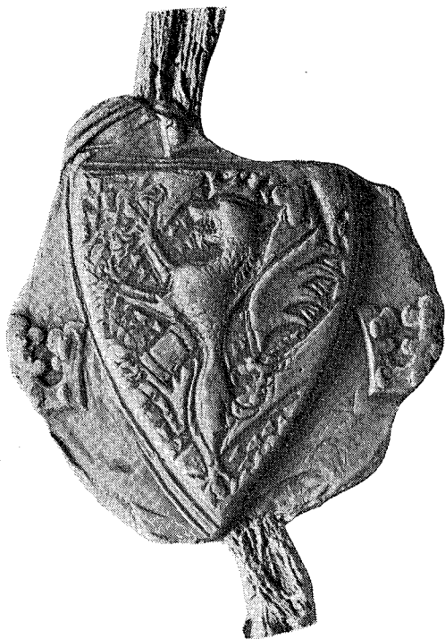
3. Folkungaskölden på Magnus Ladulås sigill 1277 omges emblematiskt av tre kronor, en över och en på var sida. Avgjutning G. Fleetwood.

disk användning. När Åberg meddelar, att trekronorssymbolen "på nytt" dök upp i det svenska riksvapnet år 1364, så snedvrider han därmed debatten om trekronorsvapnets uppkomst liksom en diskussion om dess eventuella emblematiska förhistoria.