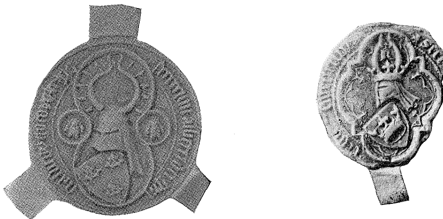
1. och 2. Konung Albrekt av Mecklenburgs sekret från 1364, visande vapen med tre kronor (t. v.), och från 1376, visande vapen med en krona (t. h.). Ur C. G. U. Scheffer, Heraldisk spegel , Stockholm 1964, s. 72.