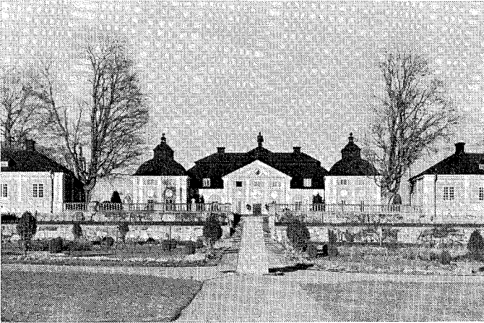
1. Allonö slott, Östergötland. Från trädgårdssidan.

av någon anledning (RA E 2483, 353, 17/7 1671). Det var icke utan stolthet, som Jakob Reenstierna den 8 aug. 1671 kunde meddela sin affärspartner Kurck: Er Excell. låter jagh i ödmuikheet förståå, at jagh i desse dagar wäntar ifrån Hollandh 30 000 mursteen, hwilka skola wara till Eders Excell. behoeff i Allnö, och skulle jagh wäll medh mine prämar dem dyt senda, om bruksdriften det tillåter . . . (E 2483, 456).