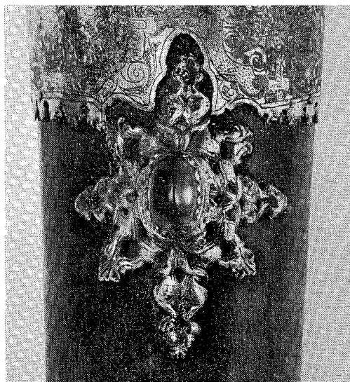
2. Detalj av fig. 1: beslag av forgylt bronse omslutende en bergkrystall.

hadde utrettet for sitt kloster. Der heter det bl. a.: "Naar vi derefter hyppigt staar og betragter disse gamle og nye Prydelser med Moderkirkens Følelse og naar vi ser hint beundringsværdige Kors af St. Elegius og hans Efterfølgere og den uforlignelige