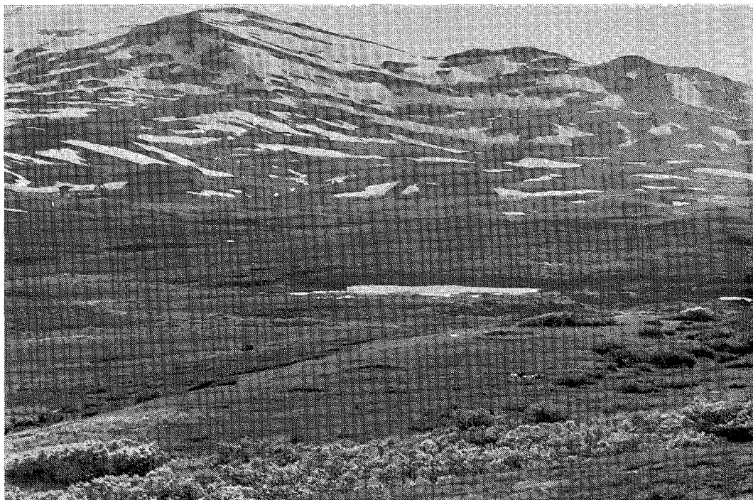
S. k. stalotomter liggande på ås vid Bævervandet i Norge, norr om övre Ältsvattnet, Sorsele socken, Västerbottens län.

Troligen var stalofolket periodvis renjägare. Jag tror också på ett nära samband mellan stalofolket och utnyttjandet av befintliga fångstgropsystem i det aktuella området.