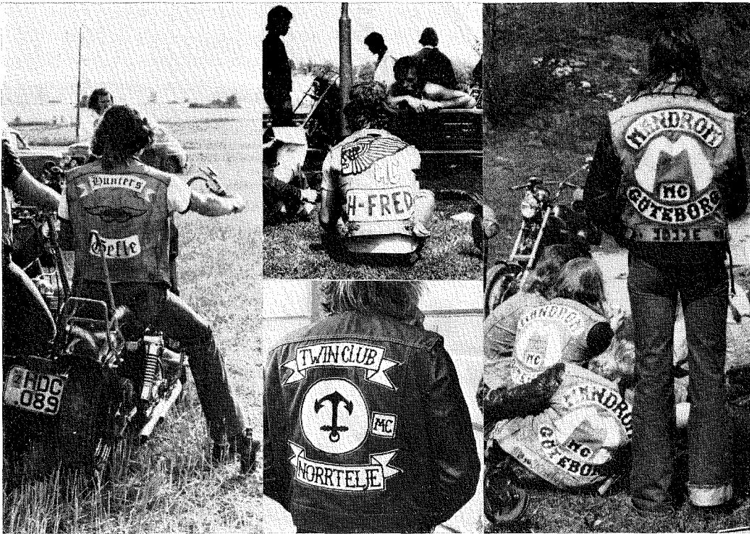
4. Svenska ryggtavlor. Foto förf. 1976—77.

kom med sin ombyggda maskin att själv bli en förebild (han var redan tidigare genom sina personliga kvalifikationer något av en ledargestalt).