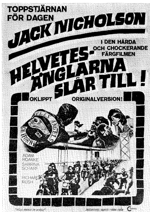
7. Reklamaffisch för Hell's Angels-film.