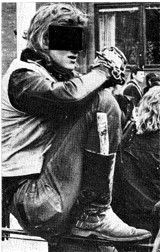
6. Mc-buren motdemonstrant beväpnad med kätting vid 1 maj-demonstrationerna i Borås 1972.

ra [det] ur lite grann. Blev själv överraskad. En del sprang upp på trappan och skrek Sieg Heil. Märkte att det blev uppskattat . . . Det var en sida som jag som ändå varit med en hel del aldrig sett tendenser [till tidigare].” Efter filmen samlades man igen och efter ett uppehåll i Kungsträdgården utan intermezzon — ”[hade] intrycket att polisen fått stränga order att vara följsam” — åkte man ut till Skarpnäck och åt ”en djävla massa korv” samt öl (som ett bryggeri bjöd på).