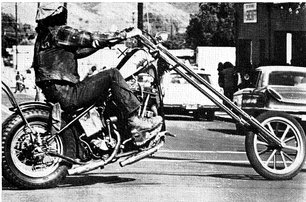
1. Chopper i filmen Hämnens änglar (svensk premiär 1972).