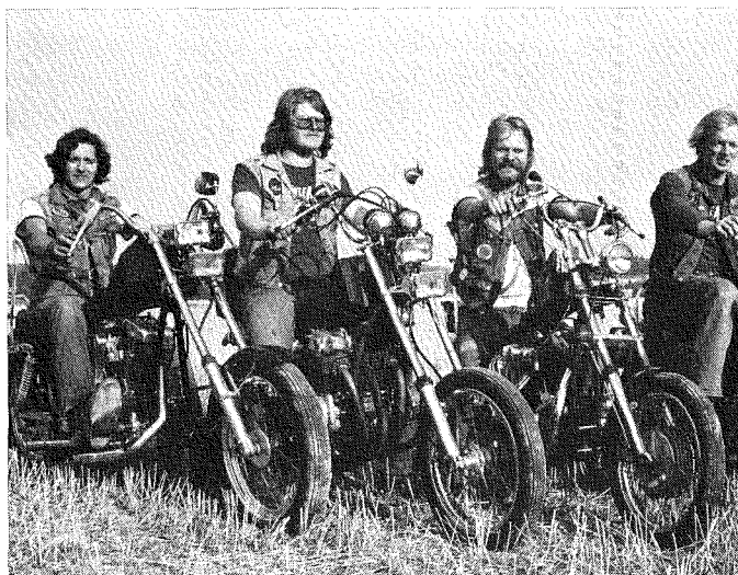
2. Sedan choppern väl introducerats i Sverige genom filmerna har dess vidare utveckling följt olika linjer. Denna bild, från en mc-träff i Västerås 1976, visar den troligen vanligaste choppertypen där Svensk Bilprovning allt strängare normer satt gränsen för ombyggnationerna.