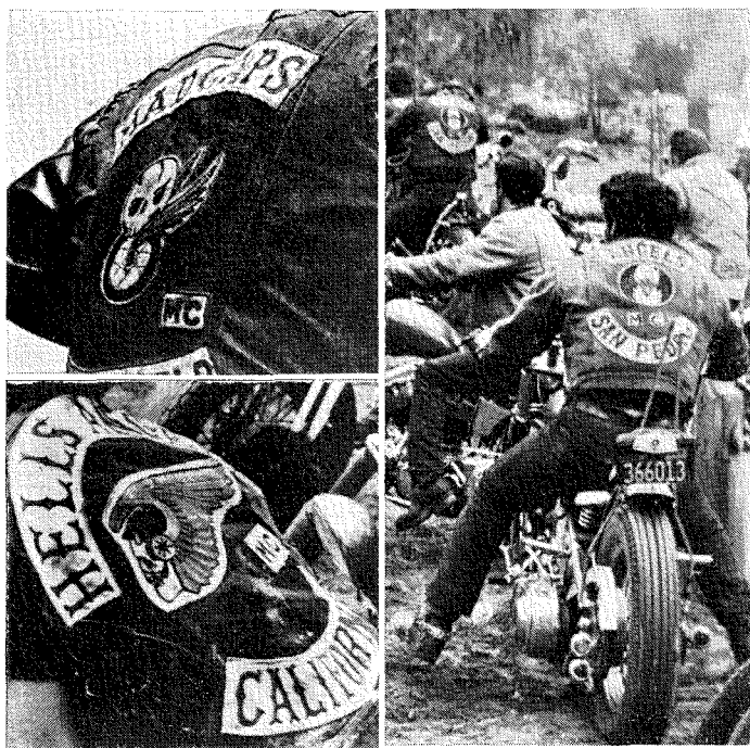
3. Exempel på ryggtavlor från tre olika filmer.

”Ser man på helhetsintrycket så förstår man vad man ska göra att få rätta stilen på’n.” Och som ovan antytts fanns inga färdiga chopperdelar att tillgå utan var och en fick vara sin egen konstruktör. Det tycks redan från början ha varit så att man ibland överlät åt vissa kamrater med dokumenterat handlag att utföra speciella detaljer (så är det i hög grad idag då somliga blivit närmast professionella på att utföra motivlackerbeten m. m., vilket också ger kundunderlag för små starkt specialiserade butiker och verkstäder).