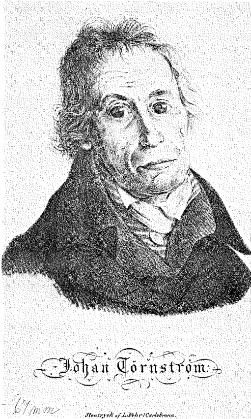
6. Johan Törnström. Litografi av Ludwig Fehr. Blekinge museum, Karlskrona.

På Fehrs litet blacka litografi, fig. 6, möter vi i stället en trött och spröd åldring med tomma, drömmande ögon. Det skulle dock dröja ännu bortåt sju år innan han gick hädan. 10