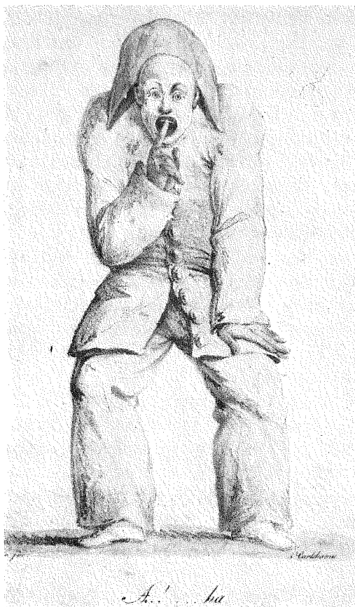
4–5. En pierrot. Akvarellerade litografier av Ludwig Fehr. Nationalmuseum, N M.

tens traditionsbundna aktionsregister återkommande gest och uppsyn vilken pantomimiskt tolkar en stupid förtjusning, i en vändning direkt mot publiken. (Ofta reproducerad är t. ex. Sicardis punktgravyr från 1789, "Ah, che boccone" – Åh, vilken munsbit, visande samma gest.)