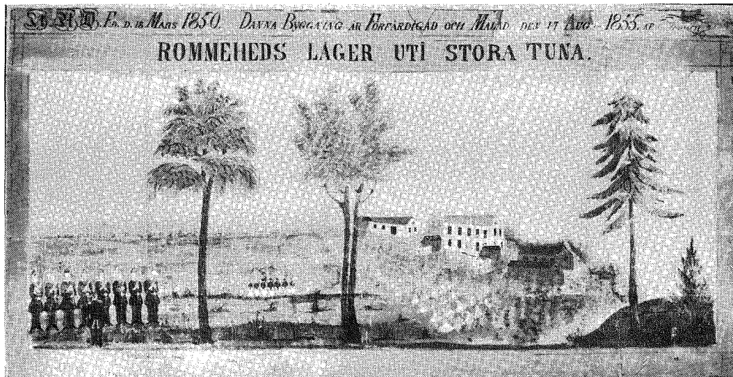
3. Rommeheds lägerplats i St. Tuna socken. Målning som föreg.

sam historia som här endast i korthet skall rekapituleras efter författarens utrönande från 1965 och de närmast följande åren.