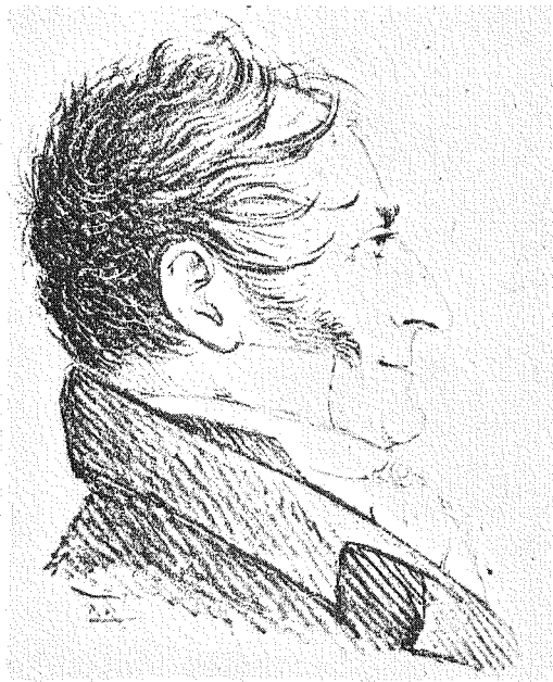
1. Fredrik Boije. Litografi av Ludwig Fehr.

När detta skrevs hade en bister kritik mot bildkvali-