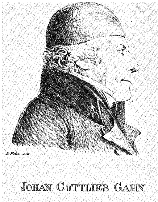
2. Johan Gottlieb Gahn. Litografi av Ludwig Fehr.

likväl icke alltid svarat til ändamålet, förmodar hon dock at fullkomligt hafva ersatt denna brist genom iblandandet af kopparplåtar i flera färger och manér.”