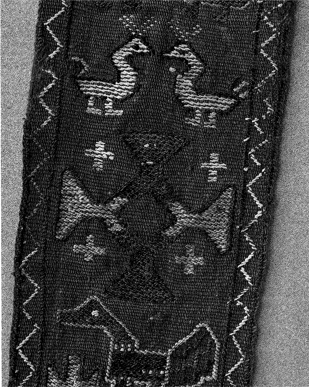
2. Detaljbild av listen från Dals socken, Ångermanland. Mot en röd bakgrund framträder fågel- och korsmotiv, utförda i övervägande snärjteknik.