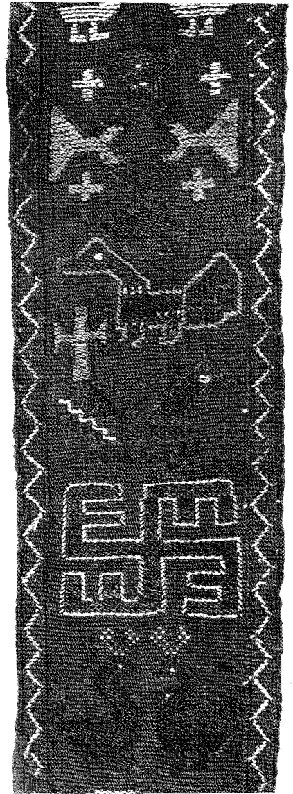
1. Listen från Dal fotograferad i fyra delar så att motiven i slutet av en del återkommer i början av nästa. The band from Dal photographed in four parts. The end of one part is overlapping the next.

den med mönstring i snärjteknik, en teknikterm som han själv föreslog vid publiceringen.