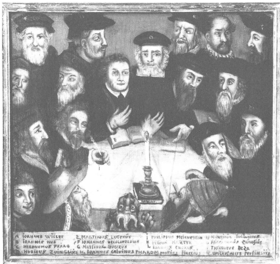
Fig. 13. Predella i altaruppsatsen i Sunne kyrka, Jämtland, 1701. Symboliskt grupporträtt av reformatorerna samlade kring det evangeliska ljuset.

hos Kammerer i München, ingår i Veste Coburgs arkiv, upptagen som nr 44 i utställningskatalogen från 1967. "In der Mitte Darstellung Luthers in der Studierstube. Ringsum 18(!) kleine Bilder mit Wiedergaben Luthers Leben mit jeweiliger Unterschrift."