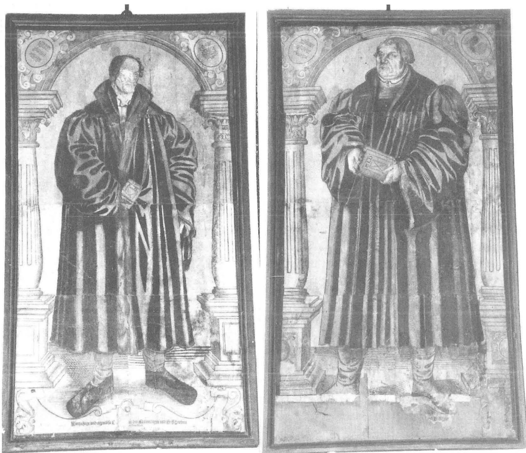
Fig. 2 och 3. Luther och Melancthon. Porträtt i helfigur i stort format, hopsatta av 11 separata blocktryck, som ger en sammanlagd höjd av ca 150 cm. Sankt Lars kyrka, Söderköping.

flesta kopiorna både när det gäller måleri och skulptur.