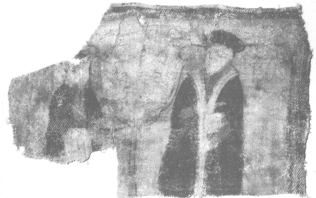
Fig. 1. Del av bonad, påträffad i Alfta i Hälsingland, 56,5x36 cm. 1500-talets slut. Luther och Melanchton ses här flankera ett standar med svenska riksvapnet. HM 18223.

rade ben i hosor och knäkorta byxor (Troels-Lund, del IV, s 30, och Flamande-Christensen 1934, bild 52 och 44–45). Figurerna bedags inte av någon nu iakttagbar text, men två lärde män med bibel i hand för genast tanken till Luther och Melanchton, som i otaliga framställningar förekommer i par. Gravyrer av de bägge efter Lucas Cranach och andra tryckares alster spreds i stora upplagor, helt visst med Luthers goda minne i det vällovliga propagandasystemet att främja reformationen och befästa redan vunnna mark. Bonadsframställningen är så pass summarisk att det är omöjligt att utpeka något särskilt tryck som förlaga.