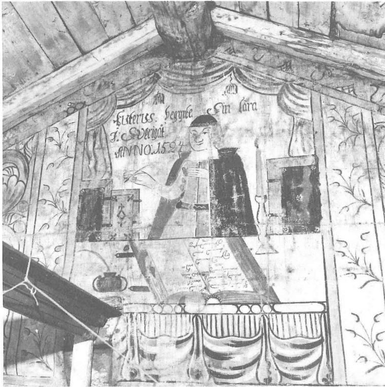
Fig. 4. Luther vid skrivbordet iförd kalott och prästkappa av 1600-talssnitt, målad på ett gavelfält i Delsbo av Gustav Reuter.

LUTHERUS DOCTOR en PROFESSOR THEOLOGIE te WITTENBERG” (fig. 6). Därtill en vers på holländska: