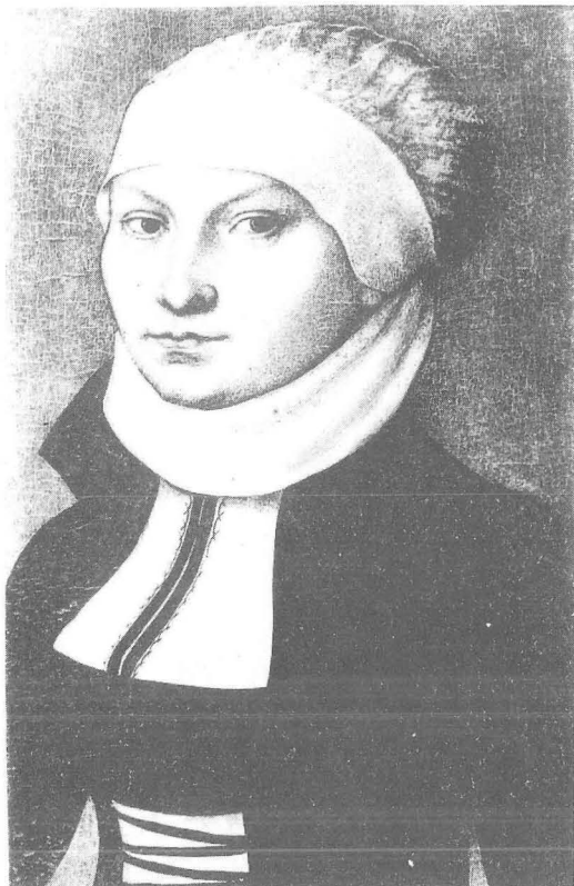
Fig. 9. Katarina von Bora vid 25 års ålder. Efter porträtt av Lucas Cranach.