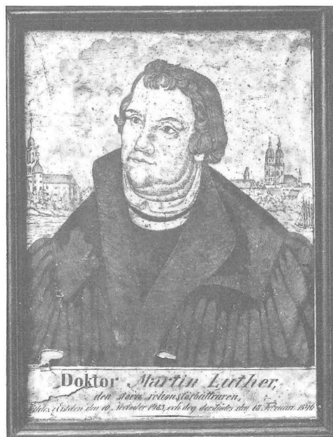
Fig. 11. Färglitografi tryckt hos Gustav Kühn, Neurupin, här utan den beledsagande versen och endast med angivande av födelse- och dödsdata. Nordiska museet inv. nr 244713.