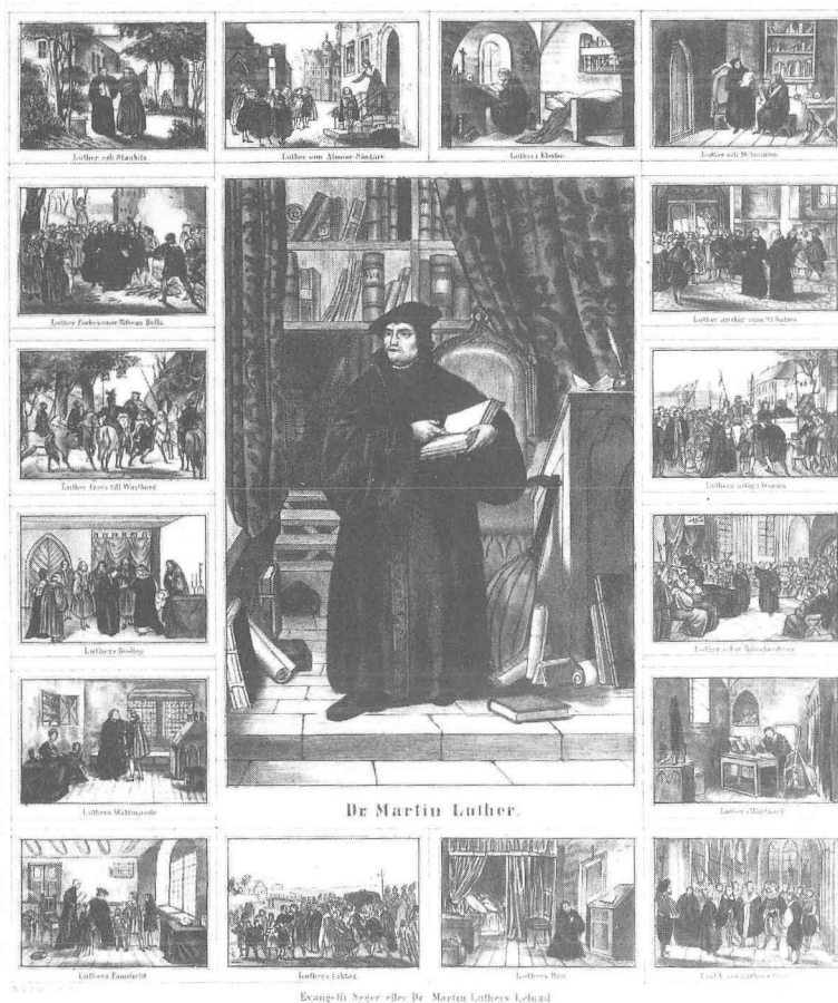
Fig. 14. Dr Martin Luthers Lefnad. Färglitografi upptryckt av P A Huldberg.

vådbredder och lämnat utrymme för en berättande svit i två register/bildrader. Bland motiv, som med säkerhet ingått, var förstas uppspikandet av teserna, brännandet av bullen, troligen också vigseln. Självfallet har man kunnat se framställningar av medkämper Melanchton, men främst reformatorn själv som centralgestalten med den nya bibelöversättningen i hand.