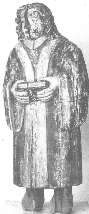
Fig. 12. Träskulptur föreställande Martin Luther, placerad i par med Johan Hus på altaruppsättning i Sunne kyrka, Jämtland. Foto från 1911 års utställning, Östersund.

holländskt stick. Motivet är utförligt behandlat av Hamberg (1955, s 111–120) och de norska exemplaren av Molland (1974, s 4 ff). Olof Thelmans målning i Sunne är dessutom publicerad i bild av Telhammer (1992, s 95) och Austagder-exemplaret i Norge av Christie (1973, del I, s 103, fig. 39). Samtliga kopister arbetar i ett folkligt manér som för tanken till bonadsmålari, även om deras arbeten är utförda på pannå. De olika framställningarna skiljer sig något från varandra och flera tänkbara förlagor har varit i om-