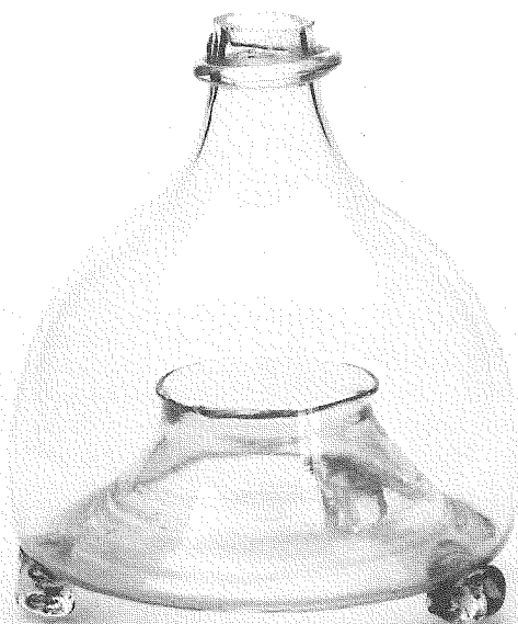
Fig. 1. Flugglas, Eptingen, Schweiz (Schweizerisches Museum für Volkskunde VI 43594.1). Omkring 1830.

den vanligaste flugfällan. I rännan hålls ättika, flaskan ställs över ett papper på vilket man strör ut en sked socker. En mosqueiro kostar 350 realer. Fattigt folk använder istället och vanligen med "utmärkt" resultat ormbunkar. Samlingarna i Museum für Völkerkunde i Berlin har nyligen kompletterats med ett portugisiskt flugglas. Varken R. Vossen eller V. Grottanelli känner till fällan från Spanien resp Italien. I Schweizerisches Museum für Volkskunde finns flugglas från Emmental, Eptingen (fig. 1) och staden Basel från omkring 1850 resp 1830 och