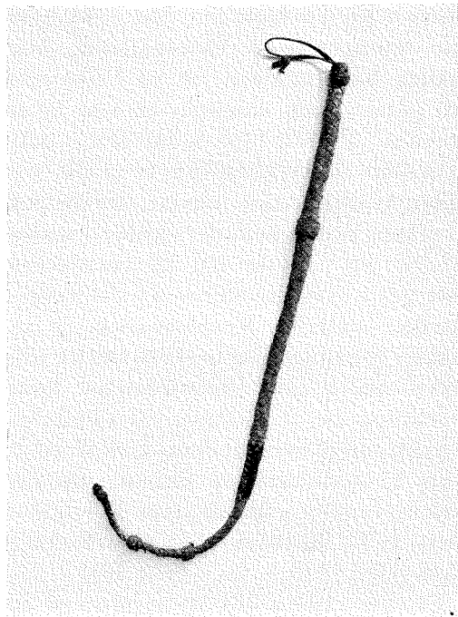
Fig. 1. Karbas av tjurpenis, den ena av två som Artur Hazelius fick som gåva av Leksands församling till Nordiska museet 1876.

På en av sina insamlingsresor erhöll Artur Hazelius 1876 som gåva av Leksands församling kyrkans båda karbaser, vilka nu tillhör Nordiska museet ( fig. 1 ). Församlingen synes senare ha skaffat sig en ersättning för dessa, i det att man före 1916 hade en karbas av flätat läder (Boëthius 1916, s. 37), medan de bortskänkta var tillverkade av penis bovis. Också i Mora kyrka finnes två karbaser, flätade av läderband, den bäst bevarade 94 cm lång. Båda finns omnämnda i ett inventarium 1836 (Bergman 1984, s. 507). Från Rättvik talas 1848 i en bröllopsskildring om "spögubben med sin oskiljaktiga läderkarbas i handen" (Hemseder i Dalom 1848, s. 116). Det finns gott om sådana framställningar både i ord och bild från dessa bygder. Vad som framförallt tilldragit sig uppmärksamheten är den strängt rangordnade processionen mellan prästgård och kyrka. Jag anför här Lars Levanders redogörelse för Älvdalen: "Strax före klockan tio ställde processionen upp sig utanför prästgården, först kyrkstöten (spögubben) med penis bovis (ukks-tittn) i handen för att bana väg, så prästen och brudgummen i bredd, så brudtärnorna (brask-kullor) två och två, de minsta först och största sist, så bruden och sätan i bredd och sist den övriga skaran" (Levander 1914, s. 19). Ungefär på samma sätt var processionen ordnad i de andra socknarna, men ibland kunde det vara två spögubbar, varvid den förste