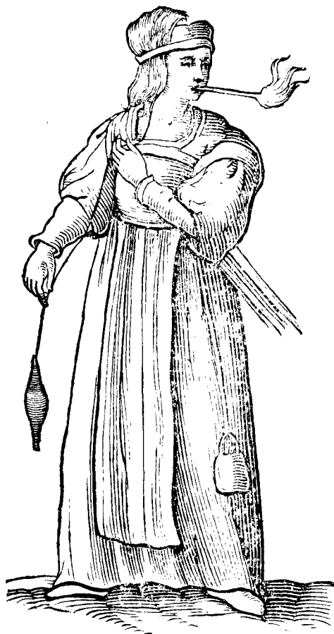
Fig. 3. Illustrasjon til Cesare Vecellio: Habiti antichi et moderni di tutto il mondo. Libro V. de gli habiti Settentrionali, "Donne Settentrionali", s. 293. Utgaven fra 1598.

Cesare Vecellios bok illustrerer klesdrakter fra hele verden, og han har selvfølgelig søkt opplysninger om sitt emne der hvor han kunne finne dem. Olaus Magnus bok må ha vært kjent for ham, og det å låne fra andre kunstnere uten å angi kilde har vært helt vanlig både blant malere og musikere. I dette tilfelle skulle en da stå overfor et lån fra Olaus Magnus, mens en ellers kjenner bedre til at det har gått den motsatte veien. Det er forsåvidt ikke noe merkelig i det. Siden Vecellios emne er drakter er det naturlig at han i teksten til sitt bilde oppholder seg ved det kvinnen er utstyrt med, innbefattet håndteinen. I Vecellios versjon er hun mindre primitiv enn hos Olaus Magnus, og hun har fått en pung hengende ned fra beltet. Men hele holdningen, forkleet, tyristikkene i beltet, er