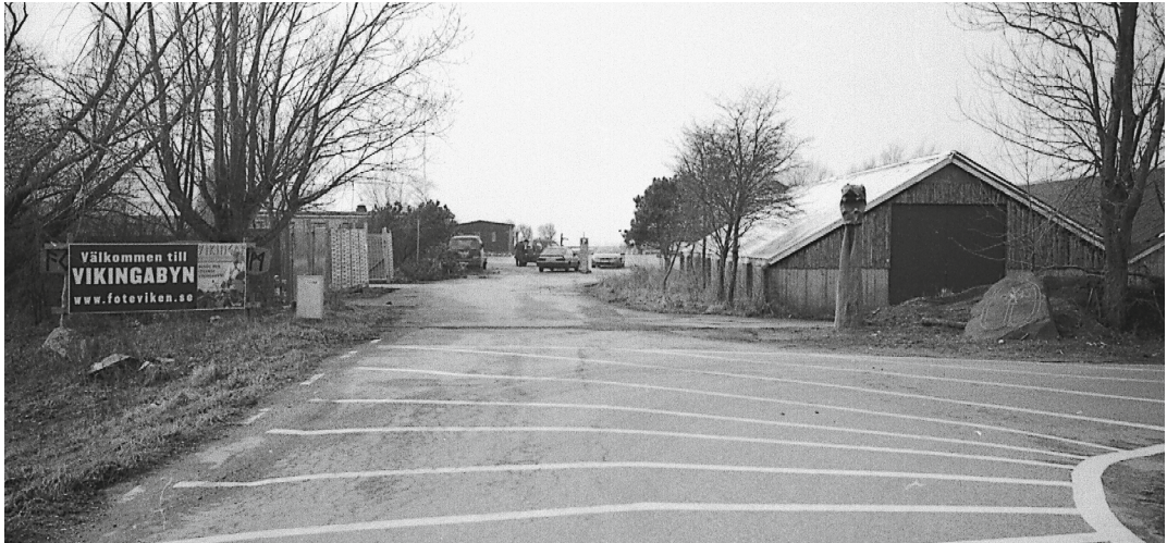
bild av en www-adress och en viking, ett större drakhuvud i trä och en liggande runsten.