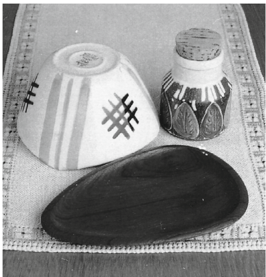
Vardagsföremål med asymmetriska mönster och former.