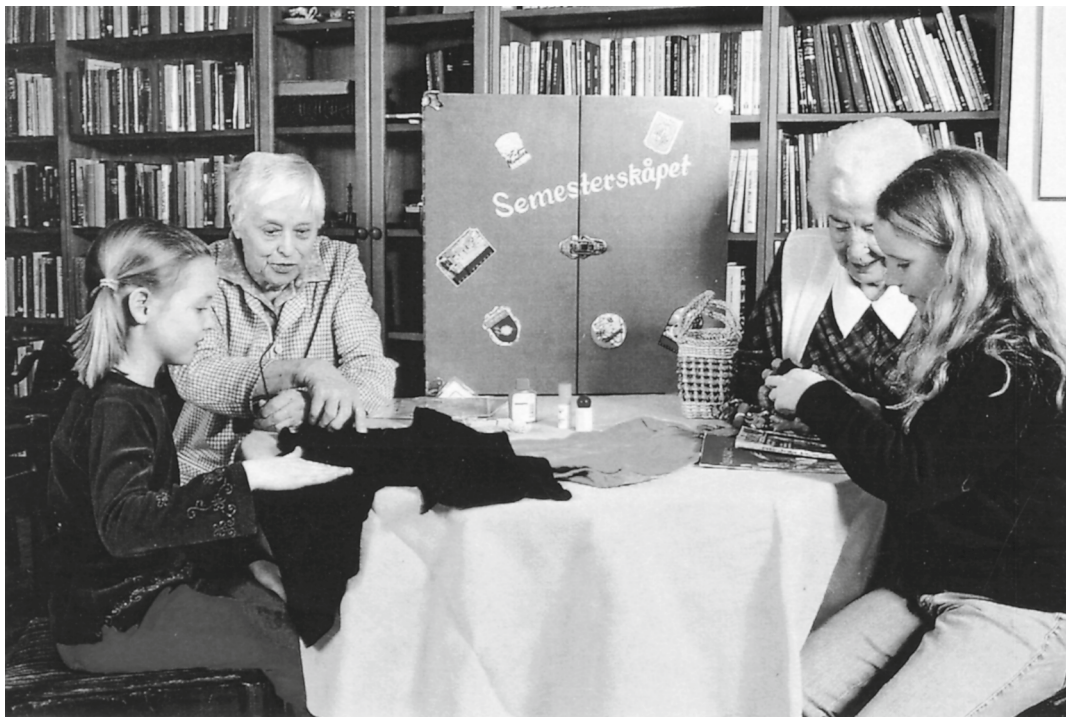
Samtal över generationsgränser om baddräkter och andra ting.

verkar till förändring (Gunnemark 1998:23, 38). Detta medför i sin tur att upplevelser av en livsfas, tonårstid, småbarnsförälder, ålderdom etc., kan skilja mellan olika generationer. Men trots skiftande samhällsförhållanden vid olika tidpunkter finns det gemensamma beröringspunkter (jfr Öberg 2002:47). Vi kan identifiera likheter och skillnader mellan vår egen generation och andras.