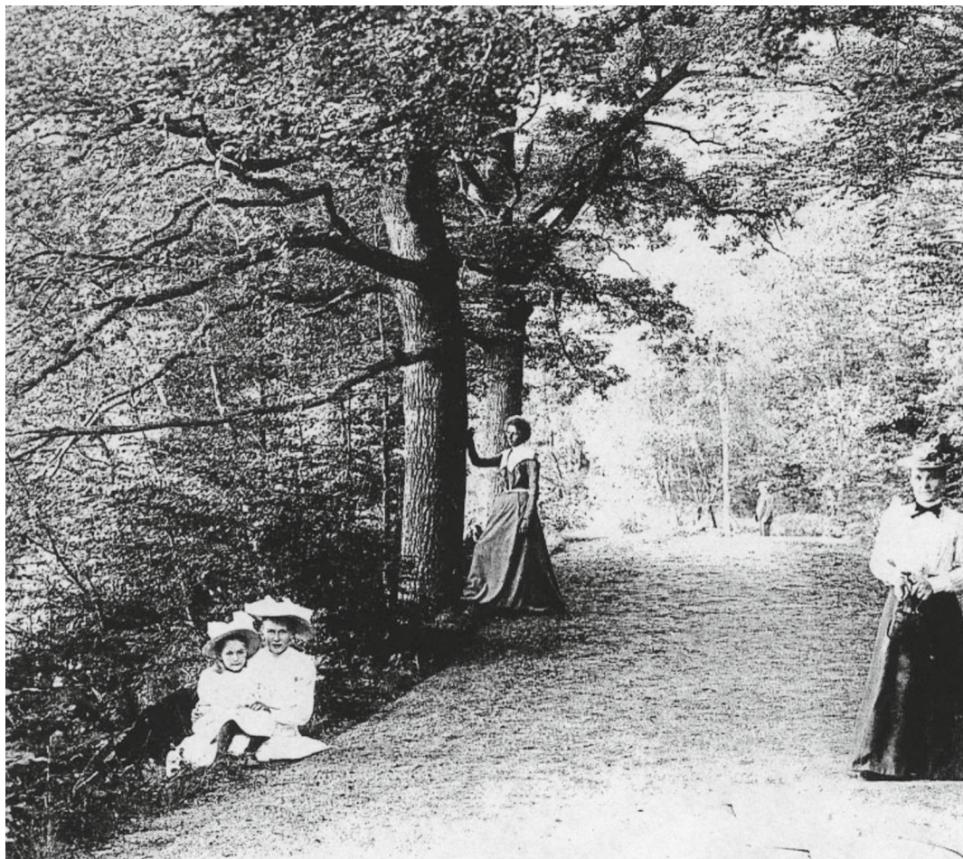
Vandrande brunnsgäster i Brunnsskogen, Ronneby Brunnspark, ca 1900.

1883). Eftermiddagarna var vigda åt utflykter eller lugn och ro, beroende på läkarens ordination. Middagen äts gemensamt vid ett visst klockslag och sänggåendet var också schemalagt. Trots detta upplevde brunnsgästen många gånger att tiden stod still, framför allt under eftermiddagarna, att man inte hade något att göra och att tiden tycktes gå oändligt långsamt: "[...] du afundsvärda, som varit ute och rest, utrikes till och med. Här är så enformigt och ruskigt väder [...]", står det på ett vykort från Ronneby Brunn den 11 augusti 1902 (Blekinge Museum). Att samma sak upprepades dag efter dag, att frid och lugn