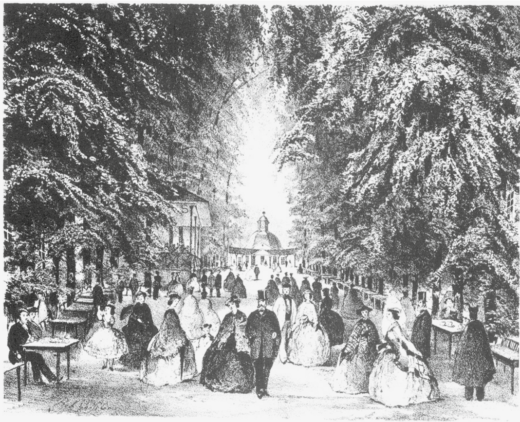
Bad Pyrmonts "Haupt allée" 1860 i en litografi av Robert Geißler. Vykort, Bad Pyrmont 1998.

han, skulle finnas i stort antal även om det blev på bekostnad av planteringar och gräsmattor. En musikpaviljong ville Müller placera centralt, nära källan antagligen, så att besökarna kunde samlas runt den. För att musiken skulle höras tydligt skulle träden som stod runt om paviljongen vara uppstamade. Musiken gav ytterligare en dimension till den korta promenaden och något som män också gav kraft på vandringen och bestämde den takt som rörelsen och förflyttningen i rummet gjordes.