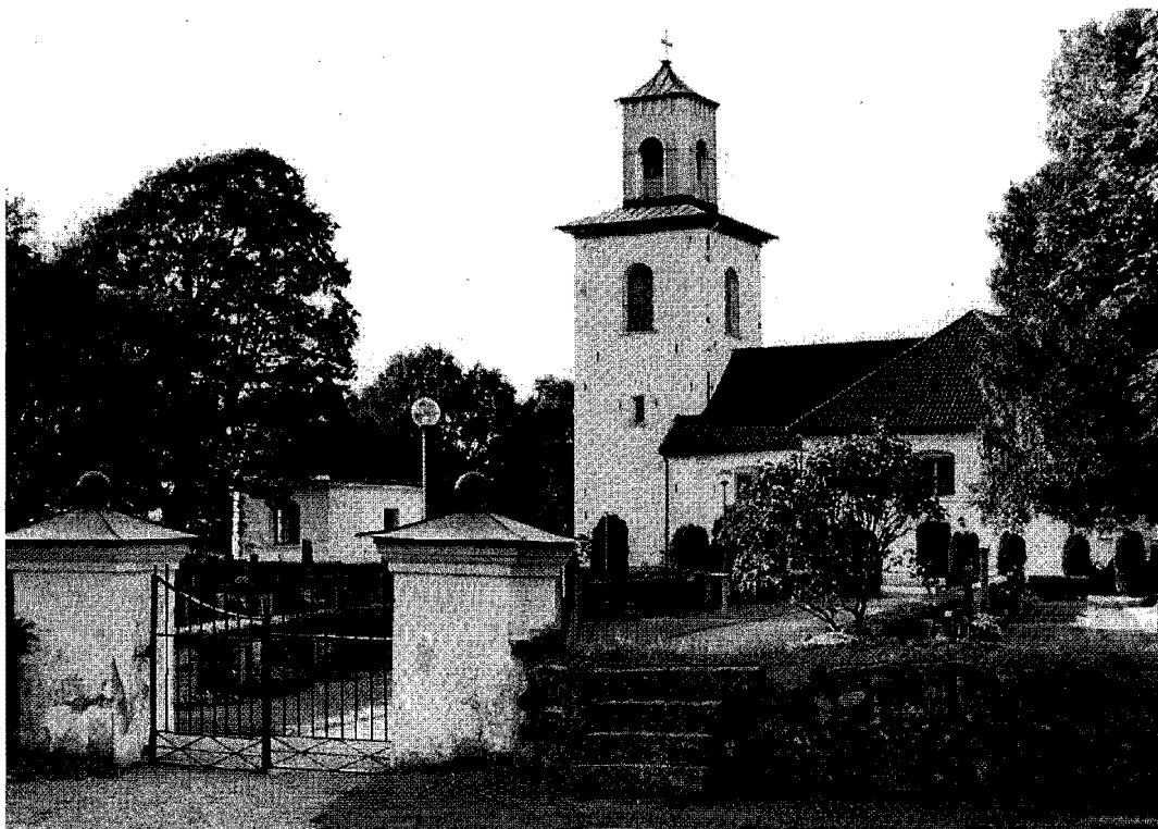
Trappan vid sidan av södra porten på Svenarums kyrkogård, som enligt den lokala traditionen använts för att "lyfta lik av självspillingar" över muren på väg till gravnen på kyrkogården.

och från Malmbäck 1661, där häradsrätten enligt domboken förordnat, att självspillingar skulle föras till skogs och brännas. 12 Också i Göta Hovrätts utslag återkommer föreskrifter som "i skogen där han ligger å båle brännas" eller "kroppen av bödelen i skogen nedergrävas". 13