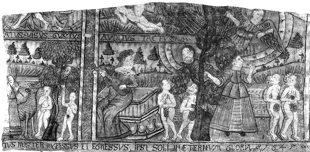
10. Hässjabonaden, daterad 1645, med framställning av de fem sinnena. Nordiska museet, inv. nr 199.675.