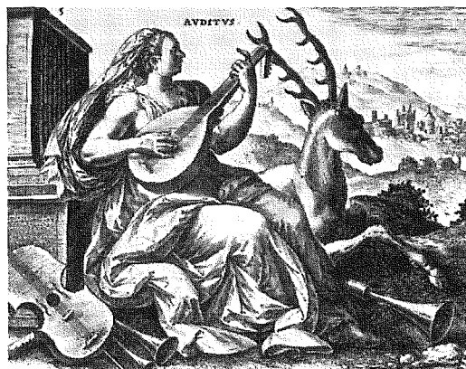
Auditus sensus sum exterior est auris et crassus quidam in ea aer interior vero nervi ab auribus ad cerebrum pertinentes