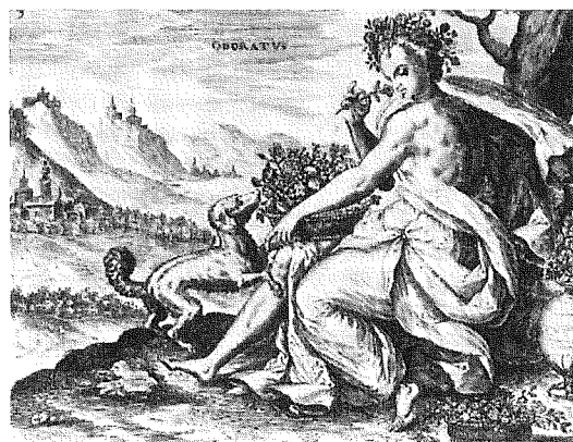
N CARUNCULIS NARIUM OSCULATUS CONVULSIT PLEURISIAM, UNDE NERVI AD CEREBRUM PERTINENT

5-9. Abraham de Bruyn. De fem sinnena, efter 1561. Efter Nordenfalk 1985 a.