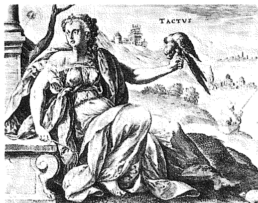
Sensus sensus sum per totum corpus expansum est, ac prorsus etiam duo organum