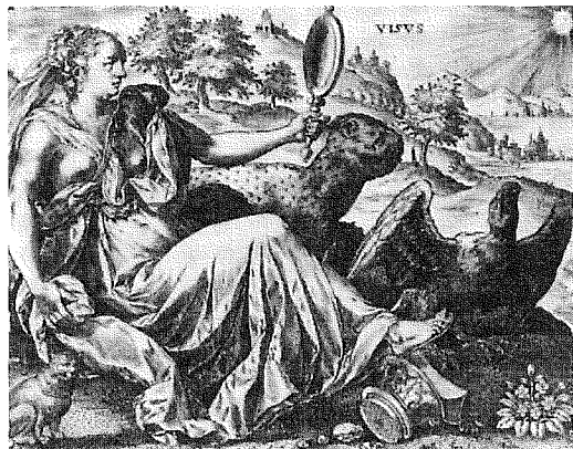
Sensus sum Visus exterior quidem sunt oculi, interior vero duo nervi a cerebro pertinentes