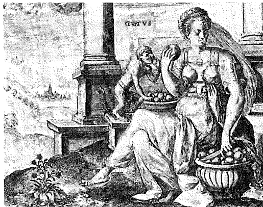
Sensus sum gustatus est nervus supra linguam expansus ad quem sapor penetrat ductus a s