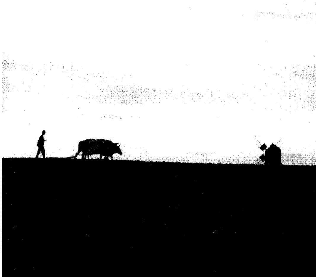
En öländsk bonde med sina oxar på en stenig åker. Föra by år 1935.

nens första skolhus, en ståtlig kalkstensbyggnad, invigas.