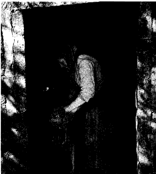
Tvätt i brygghuset. Foto: John Granlund, Nordiska museets arkiv.

Detta berättartekniska grepp; livfulla skildringar där ett viktigt syfte tycks vara att engagera läsaren i berättelsen, kom Granlund att utveckla i flera senare texter (t.ex. 1940,