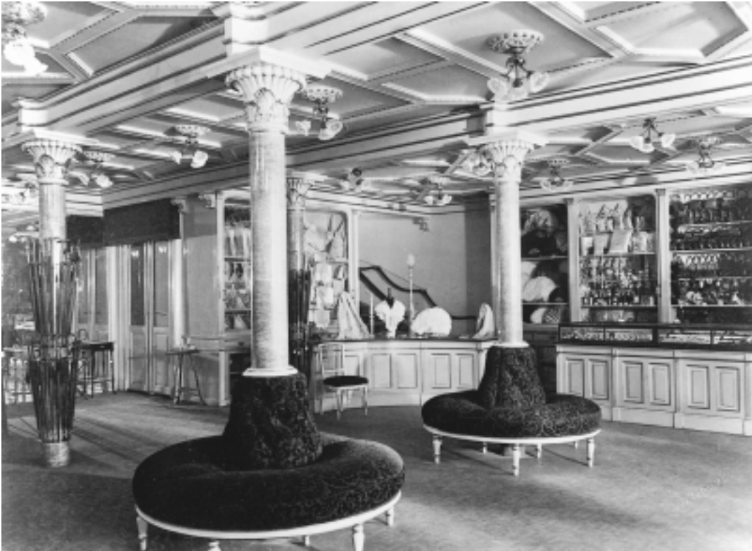
Ljus och sirlig interiör på avdelningen för modevaror och damväskor, varuhuset Josef Leja, 1897.