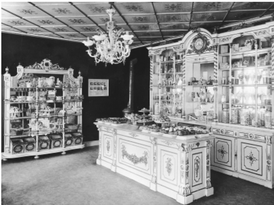
Förgyllda dekorationer på ljus botten i interiören från Schröders bageri och konditori, 1912. Konditoriet var ett av de nya rum i staden där borgerliga kvinnor tilläts vara utan skyddande sällskap. Här kunde de träffa väninnor, dricka kaffe och äta godsaker.

På 1890-talet kunde inte borgerliga kvinnor besöka en restaurang på egen hand eller i sällskap med andra damer, om de ville behålla sitt goda anseende. Tillsammans med passande manligt sällskap blev de däremot respekterade. När middagen var avslutad drog sig den manliga delen av sällskapet till kaféet, som ofta låg i ett angränsande rum. Där serverades kaffet och punschen. I motsats till i matsalen hade kaféet kvinnlig betjäning (Johansson, Rehnberg & Selling 1987:94f). Populära kaféer i Stockholm fanns på Operabaren, Berns, Rydbergs, Grand Hôtel, Kung Karl, Hamburger börs, Victoria och Strömparterren. Dit gick konstnärer, författare, ämbetsmän, officerare, grosshandlare och andra – samtliga män. Kaféet var alltså en