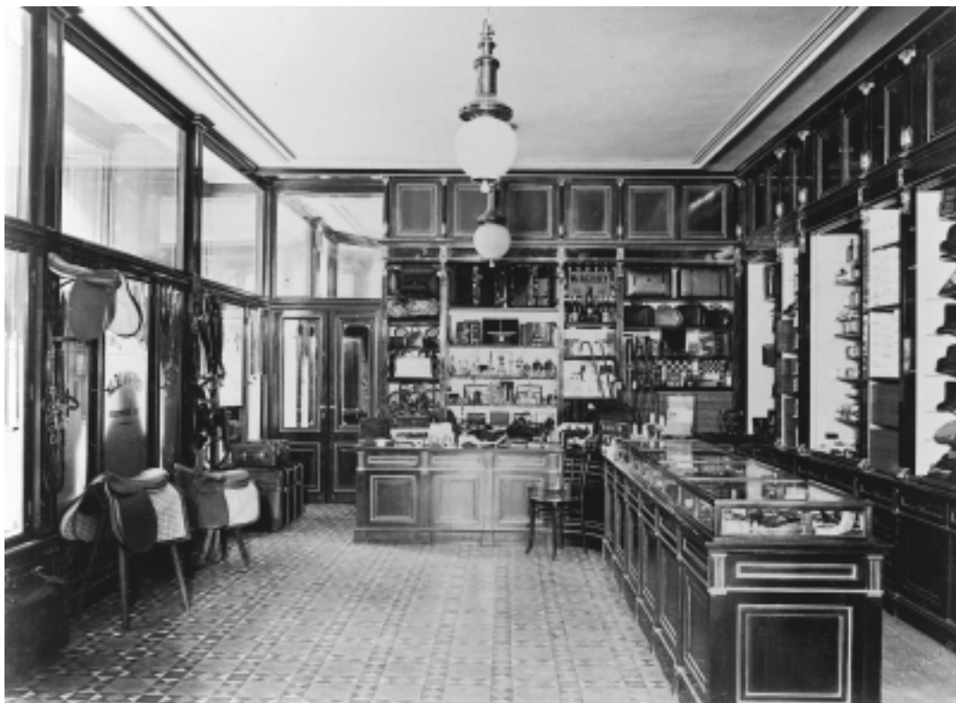
Mörk och stram inredning på herrekiperingsavdelningen, varuhuset Josef Leja, 1897.

inredningen. Den såg olika ut i avdelningar för män respektive kvinnor.