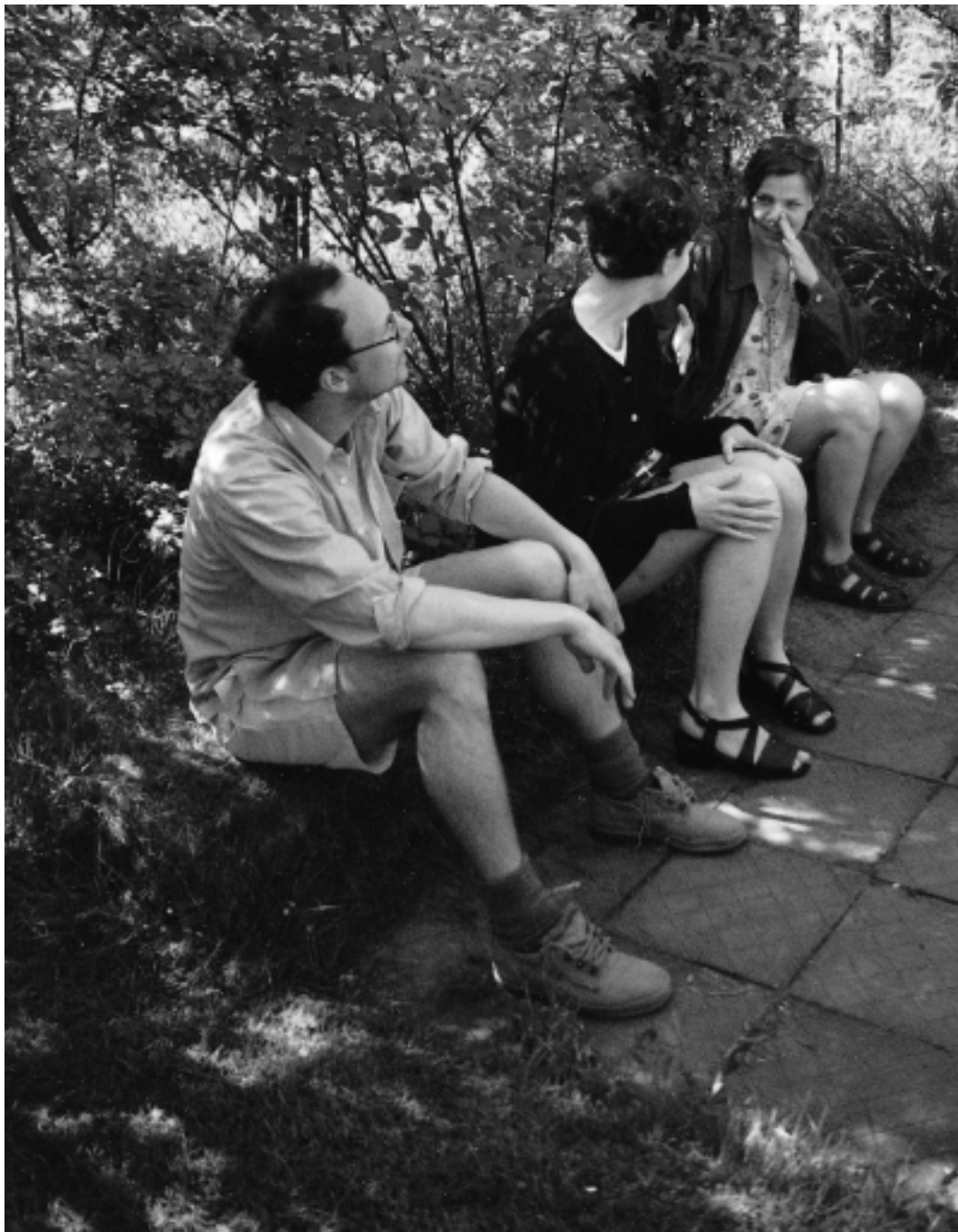
En gräsbänk av idag; i landskapsarkitekten Sven-Ingvar Anderssons trädgård.