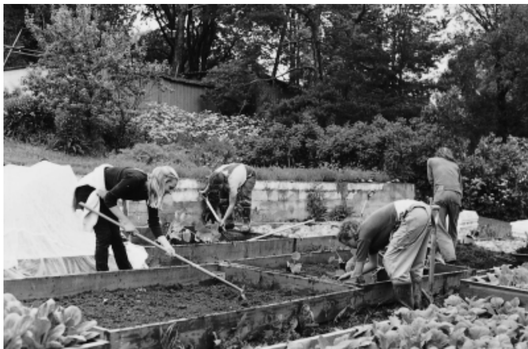
Plantering av pumpor och squash i drivbänkar.

”(Rädisorna) såås alle uthi Mullbänckarna det första man kan”, skriver Rålamb i en trädgårdsbok för adeln i slutet av 1600-talet (SAOB 1945). En av odlingssäsongens allra första skördar: rädisor! Och har man möjlighet att så dem under glas, ja då går det förstås ännu fortare. Små rosa, runda rädisor, krispiga i konsistensen och som retfullt sticker på tungan. Med fördel i sällskap med en klick smör och i bästa fall t.o.m. några ljusgröna blad plocksallat. Att odla i drivbänk. Det är