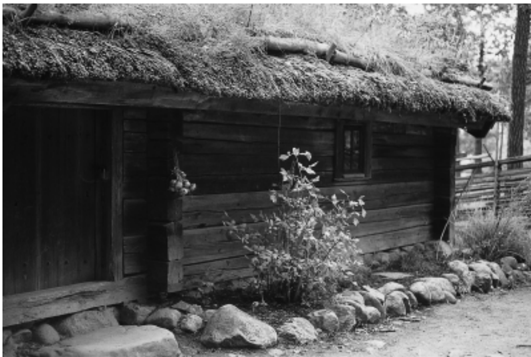
Mullbänken vid Hornborgastugan på Skansen.

Vid ett besök på Skansen i Stockholm, en halvmilen första oktober, sökte jag upp Hornborgastugan. Denna knuttimrade, enkla boing är troligtvis byggd på 1700-talet i Västergötland och är ett exempel på hur inhyses-hjon som t.ex. soldater bodde. Stugan och kammaren är ihopbyggda med fähuset och ladan. Till vänster om ingången, utmed stugans ena lång- och kortsida finns en mullbänk, en rabatt. Idag växer där bl.a. libbsticka, ålandsrot och pepparrot. Det var medicinalväxterna och de aromatiska luktväxterna som man hade nära till hands intill stugväggen. Som lavendel, åbrodd, salvia och isop med sina olika dofter och egenskaper. Där fanns naturligtvis också växter för prydnad och ögonfröjd. I torparens slitsamma tillvaro kunde våren hälsas välkommen av påskliljor och kejsarkronor i sprakande gult och orange. Senare, under sommaren, blommade ringblommor och pioner. Och hur