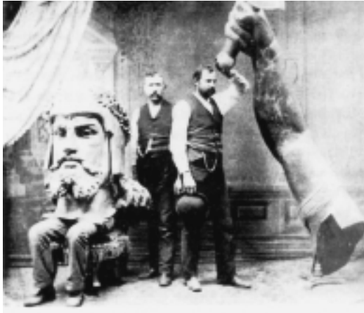
Monumentens väldiga proportioner, vilka krävde en laginsats av en mängd konstnärer och hantverkare, framgår av denna bild, som visar en paus i arbetet med tillverkningen av Hermannsdenkmal i New Ulm, Minnesota. Bild ur Schama, Landscape & Memory , s. 111.

gemenskapens samlade kreativitet (Smith 1986:193ff). Bronskungarnas och -krigarnas pekande med hand eller dragna svärd var sålunda inte bara påminnelser om var nuets fiender återfanns, utan också en riktningssvissare från historien mot framtiden. Steget var inte långt till Johann Gottfried Herders schema över den historiska utvecklingen som utmärktes av en gradvis förbättring, med föregående perioder som hade ett eget värde genom att de verksamt deltagit i framåtskridandet. Dessutom gick han till angrepp mot universalistiska ideal. Framåtskridandet hade störst möjligheter att lyckas i nationella kulturer som var rotade i det egna landets sedvänjor, samhällsstruktur och topografi (Kedourie 1995:92ff). Herders utvecklingstanke gick förnämligt ihop med den evolutionistiskt färgade nationalismen och monumentens flerdimensionella tid med samband mellan dåtid, nutid och framtid. Ett av de tydligaste exemplen på tillämpandet av det herderska utvecklingsschemat återfinns hos den österrikiske konstkritikern Alois Riegl. I en postumt publicerad artikel om monument-