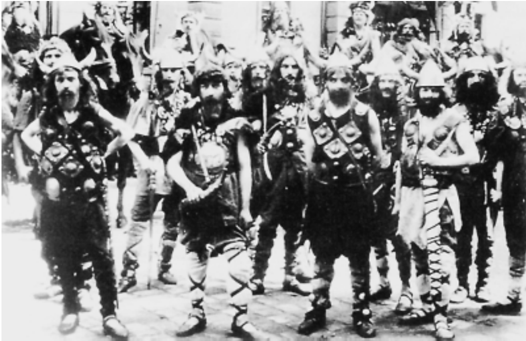
Monumenten var viktiga samlingsplatser och den givna utgångspunkten för jubileer och nationella fester årtiondena kring sekelskiftet 1900. Här ser vi några festdeltagare vid ett firande av Hermannsdenkmal som med utgångspunkt i tidens romantiska historiesyn och tysk-skandinaviska vikingavurm försöker efterlikna de germaniska krigare som besegrade romarna år 9 e.Kr. i Teutoburgskogen.

större var möjligheten för politisk och militär stabilitet. Denna föreställning konkretiserades via monumenten. Johannes Schillings Germaniamonument i Niederwald, invigt 1883, blev en bronserad illustration till budskapet i kampsången "Die Wacht am Rhein", som underströk betydelsen av Rhen som gränsflod gentemot romerskt, och i modern tid, franskt inflytande. Liknande tankar låg bakom monumentet över kejsar Vilhelm I, vilket uppfördes 1881 på en höjd där Rhen möter Mosel. Inskriptionen klargjorde att det tyska riket aldrig skulle bli ödelagt – en slutsats som baserades på övertygelsen om att samtida och framtida fiender aldrig skulle kunna korsa Rhen. 5 Principen synliggjordes även på våra breddgrader. I Malmö och Helsingborg uppfördes 1896 och 1901 rytтары över Karl X Gustav, karolinerkungen