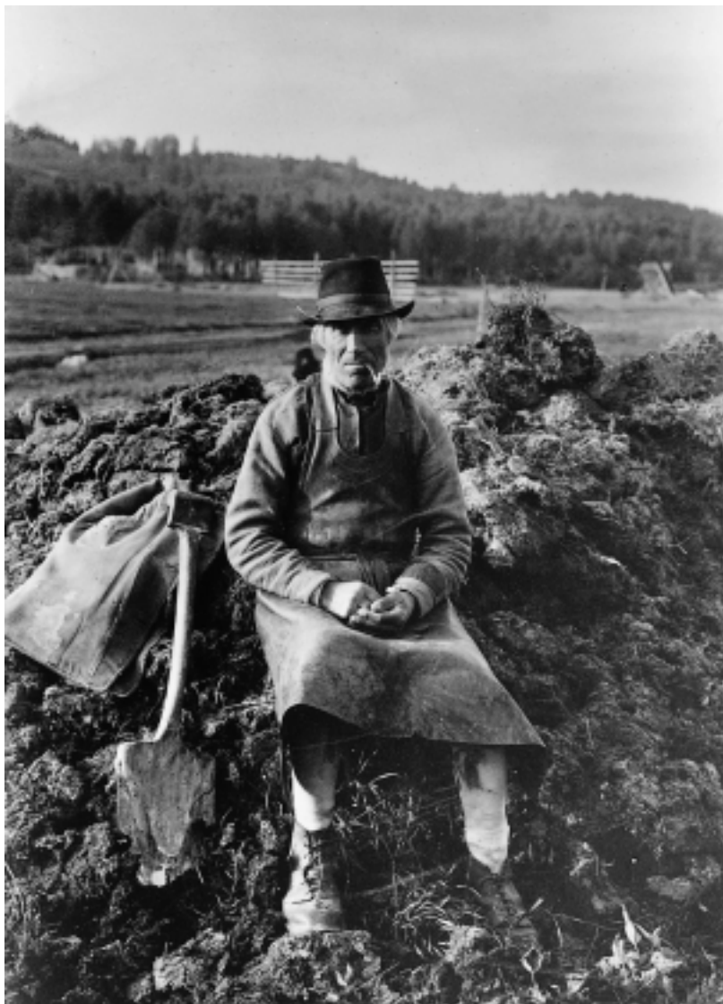
Figur 1. 1800-talets agrara moderniseringsval handlade bland annat om nyodling och dikning. Hemmansägaren Hjært Per Persson, Djura, Dalarna.

och med övergripande teorier. Avsnittet mynnar ut i ett behov av att studera förändringarna också på andra nivåer och med andra perspektiv.