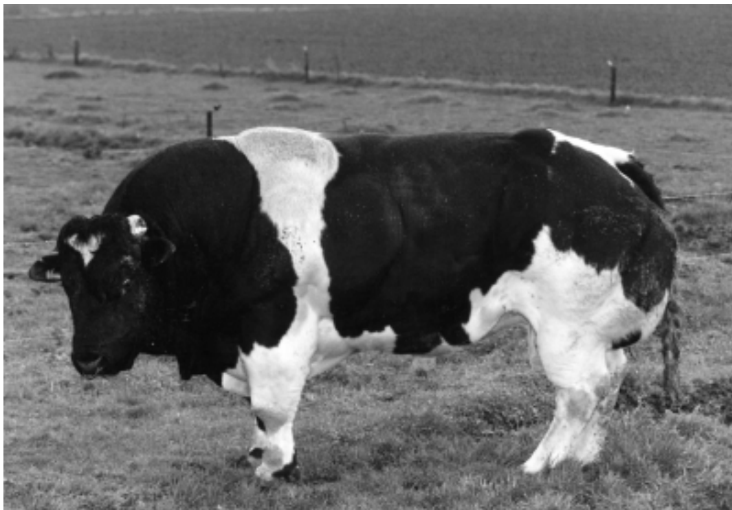
Figur 5. Dagens bönder ställs liksom 1800-talets inför svåra förändringsval. Det sena 1900-talets frågor handlar bland annat om gener, gifter och landskap. Tjur av rasen Belgisk blå.

en sådan kan det förhoppningsvis bli fråga om ett mer jämnt utbyte än i samhällsvetenskapernas långvariga teoretiska dominans och tolkningsföreträde bland humanister.