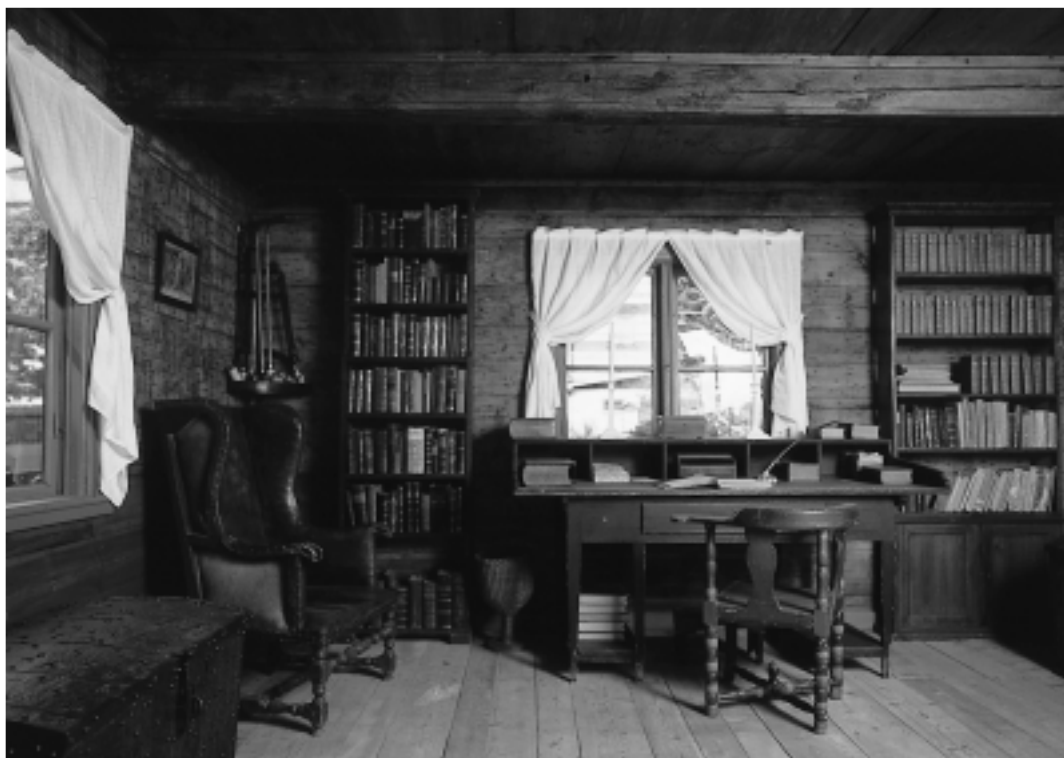
Prästfars arbetsrum med skrivbord, öronlappsfatölj och bokhyllor. V. Vrams prästgård, Kulturen i Lund.

Kulturens prästgård är emellertid inte en exakt återspeglning av prästgårdsmiljön i Västra Vram för 200 år sedan. I stället möter vi en samtida rekonstruktion av en prästgårdsmiljö, som den antas ha sett ut vid den tiden. Det museala rummet blir en plats, som för besökarens räkning har laddats med kulturhistorisk innebörd. Så framställs exempelvis studerkammaren som ett manligt territorium med dov färgskala (bortsett från de vita gardinerna), djup öronlappsfatölj och många skinnband i bokhyllorna. Vid skrivbordet kan man tänka sig prästen sittande och skrivande på sin predikan, medan prästfrun och domestikerna slamrar med grytor och fat ute i köksregionerna. I den mer privata delen av huset möts man av ett till synes mycket kvinnligt område: prästfruns toalettbord omramat