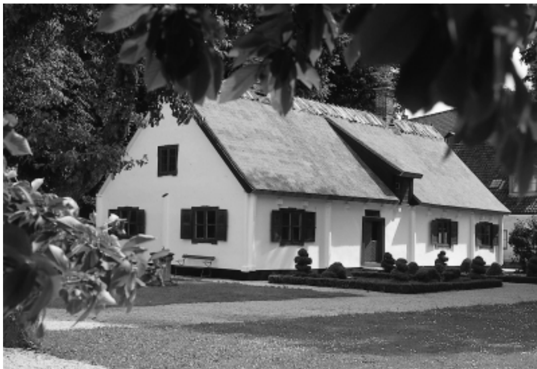
V. Vrams prästgård, byggd på 1700-talet, flyttades år 1927 till Kulturen i Lund.

de kyrkliga miljöer de kommer i kontakt med, men först en kort presentation av några i sammanhanget relevanta begrepp.