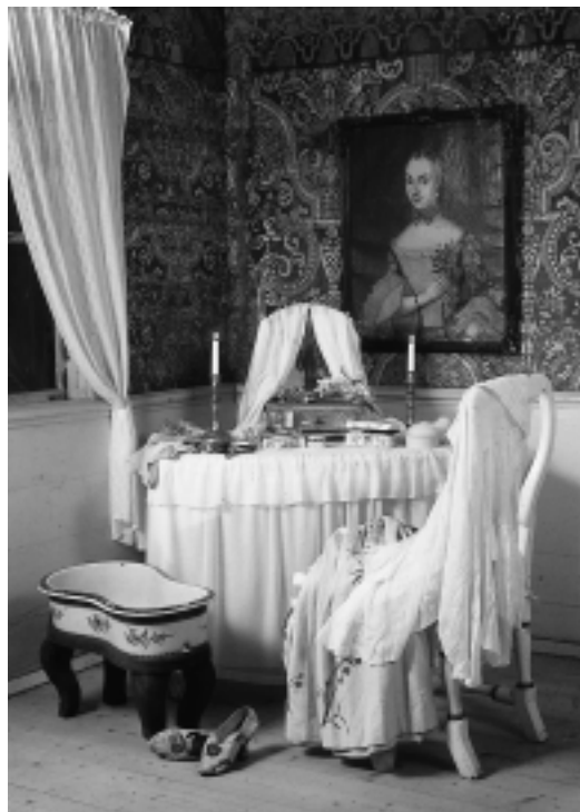
Frusna ögonblick? Rekonstruktion av prästfruns "boudoir" med toalettbord och bidé. V. Vrams prästgård, Kulturen i Lund.

av skirt, vitt tyg. Skorna på golvet och plagget, som ligger kastat över stolsryggen, antyder en tillfällig frånvaro: snart kommer husets fru att slå sig ned vid bordet för att kamma sitt hår eller fästa ett halsband runt halsen. På detta sätt har planlösningens könsdifferentierade sfärer accentuerats rent utställningstekniskt.