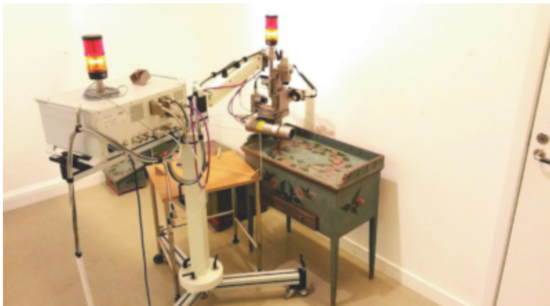
4. Grundämnesanalyser med röntgenfluorescens direkt på mössbordet på Ljusdalsbygdens museum i Hälsingland.

Den blå kulören i kistans blå färg innehåller utöver berlinerblått och blyvitt, även