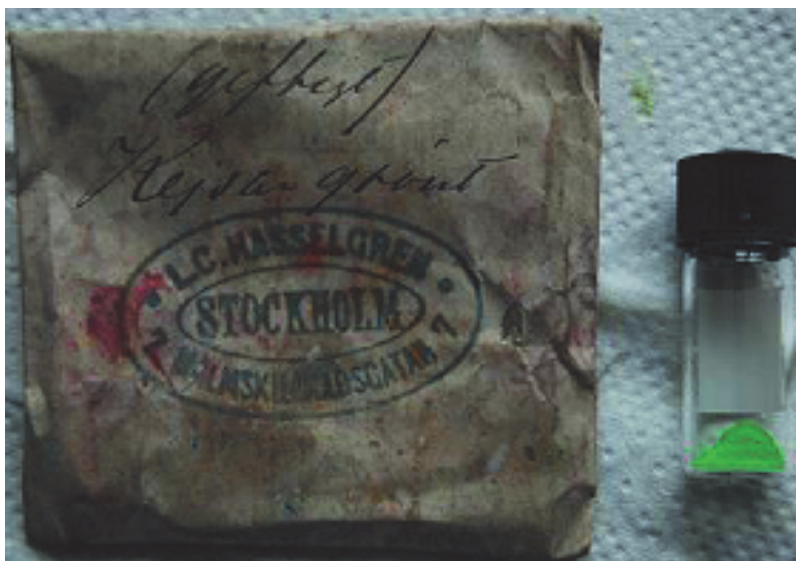
5. Exempel på pigmentpåse vid gården Bortom Åa, Fågelsjö. Kejsargrönt, det vill säga schweinfurtergrönt, vilket är giftigt och innehåller arsenik. Troligen införskaffad i Stockholm år 1876.