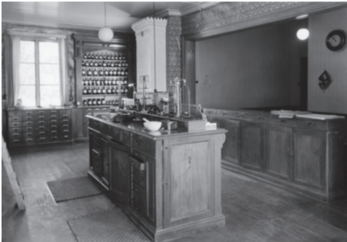
1. Apoteket i Järvsö socken var beläget på Stenegård mellan åren 1859–1951

pigment, färgämnen och bindemedel saluförts via apotek och kryddbodar, för att kring skiftet 1700 och 1800 även säljas i specerieller viktualiehandelsbodas. Såväl specerier som viktualiehandlare tillhandahöll dagligvaror och livsmedel. Specerihandeln omfattade endast torrvaror som mjöl, kaffe, salt, kryddor och liknande. Utöver torrvaror hade viktualiehandlarna rätt att även bedriva handel med färskvaror som fisk, smör, kött och dylika produkter ( http://www.saob.se ).