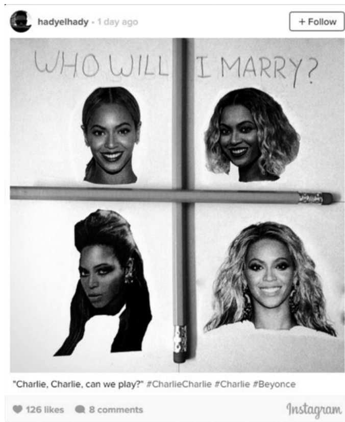
Ett exempel på mycket spritt twitter-inlägg märkt med hashtaggen #charliecharlie.

ende är exempel på avfärdande kommentarer under två svenskspråkiga videoklipp som laddades upp i maj 2015 och som tillsammans setts mer än 250 000 gånger: