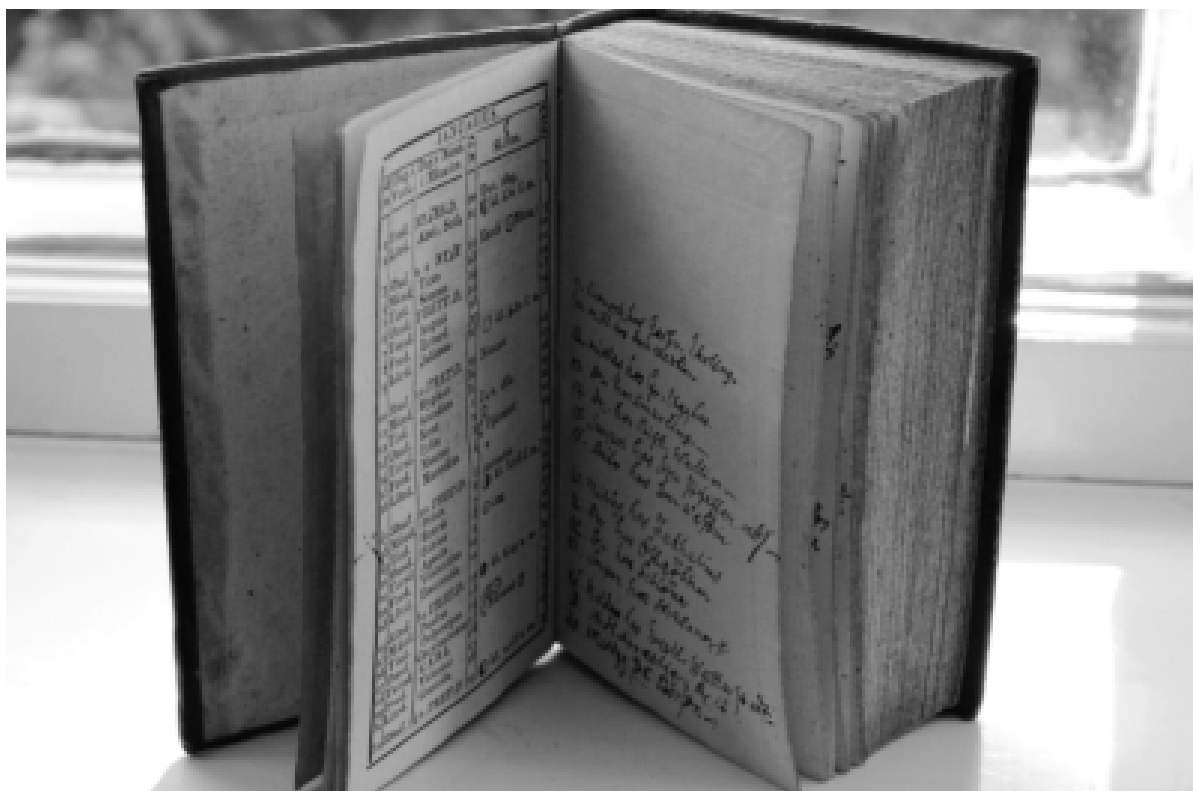
Sveriges och Norriges kalender för 1830.